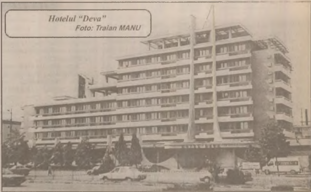
Hotelul „Deva”

Cu același prilej, a fost prezentată celor 15 primari, care au onorat invitația Primăriei Geoagiu, stația pilot de programe pe calculatoare a administrației publice locale cu ajutorul căreia este urmărită evidența populației, starea civilă, registrele agricole, serviciile de urbanism și contabilitate, relațiile cu publicul, concesiunile de terenuri etc. (E.S.)