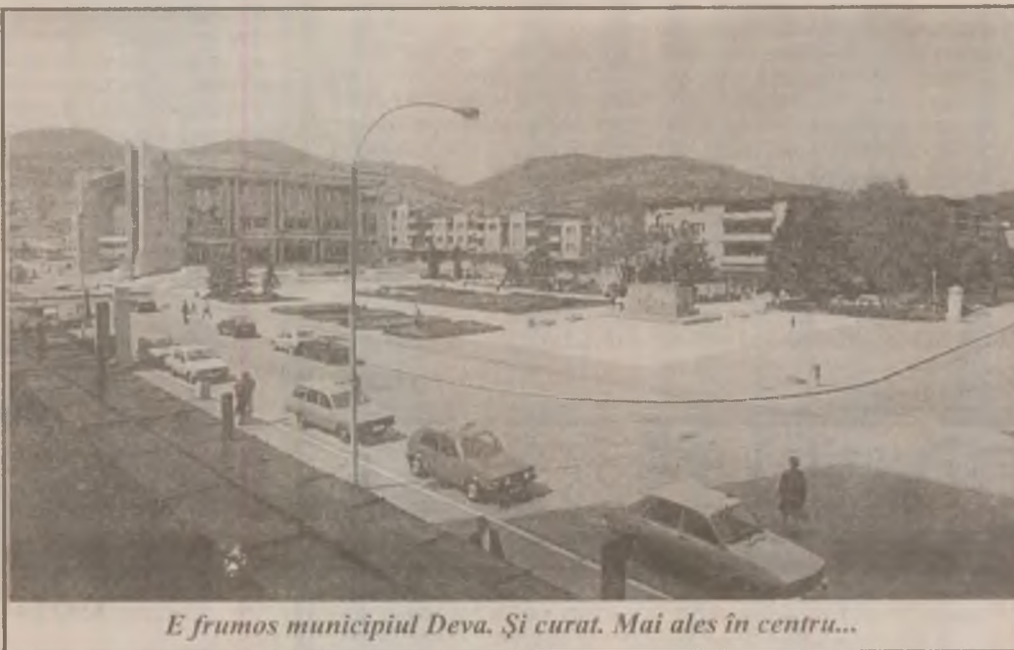
E frumos municipiul Deva. Și curat. Mai ales în centru...

Nu-i mai puțin adevărat că și acum avem legi, însă ele nu sunt aplicate de către cei îndrituiți s-o facă, stimulând astfel proliferarea actelor antisociale, purtările după bunul plac, în toate domeniile muncii și vieții, aducând atingere libertății și demnității individului. De-acum, cu ochii pe Primărie. Și ea pe noi.