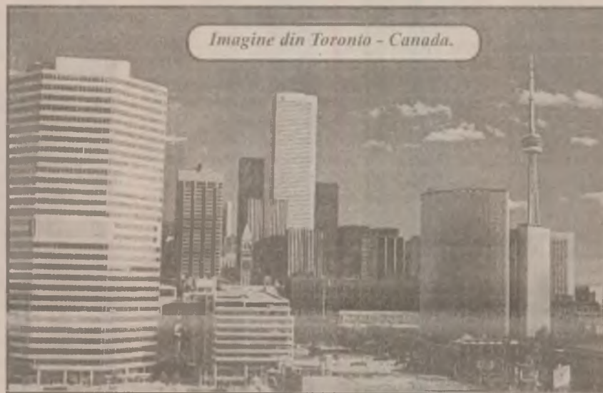
Imagine din Toronto - Canada.

În timpul sejurului său la Santo-Domingo, ceilalți clienți ai hotelului au fost supuși unor controale cu detector de metale și unor percheziții corporale, de câte ori intrau în clădire.