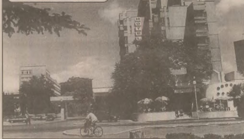
Secvență deevenă

Cei îndreptățiți să dea aceste sancțiuni sunt, în primul rând, polițiștii și gardienii publici. S-a mai afirmat că luna septembrie a fost declarată „luna curățeniei în municipiul Deva.” (V.N.)