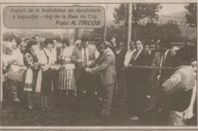
Aspect de la festivitatea de deschidere a expoziției - târg de la Baia de Criș.