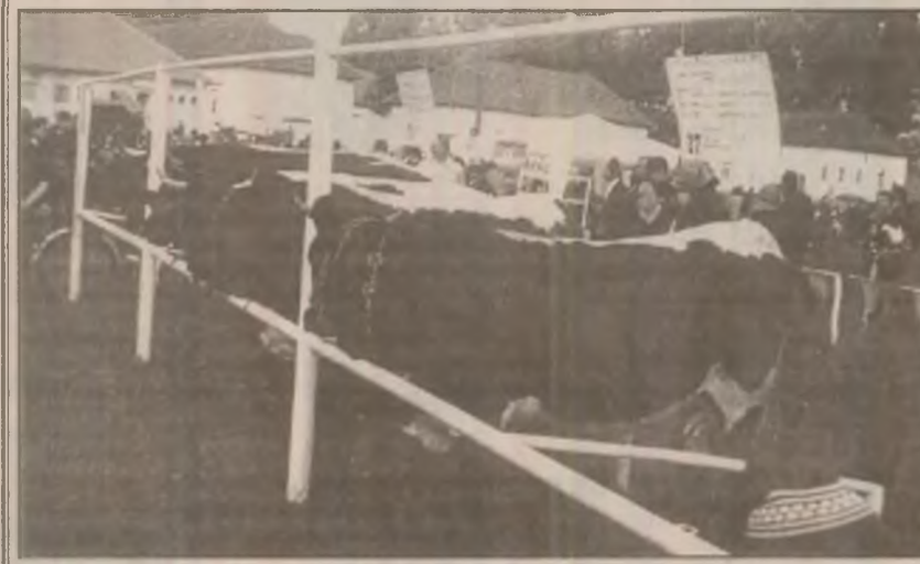
Standul cu animalele aduse la expoziție