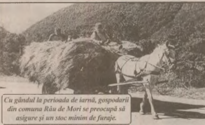
Cu gândul la perioada de iarnă, gospodarii din comuna Râu de Mori se preocupă să asigure și un stoc minim de furaj.

• S-au născut în acest an la Densuș doar șase copii, în vreme ce numărul deceselor este de patru ori mai mare.