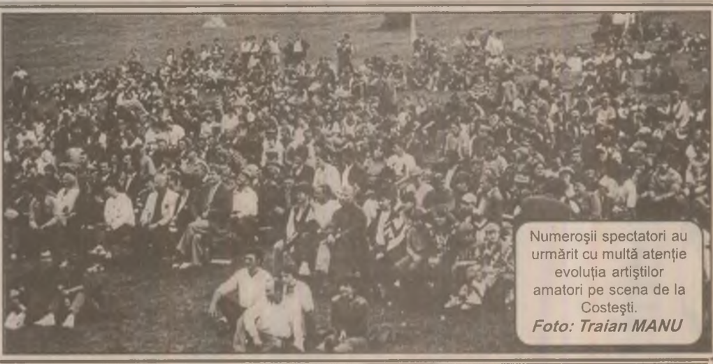
Numeroșii spectatori au urmărit cu multă atenție evoluția artiștilor amatori pe scena de la Costești.