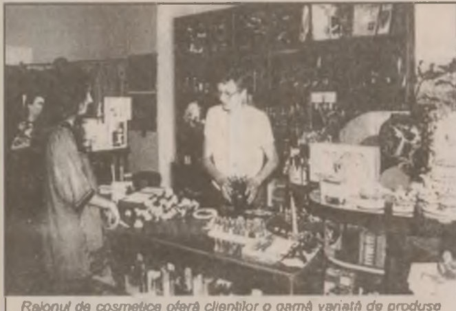
Ralonul de cosmetice oferă clienţilor o gamă variată de produse