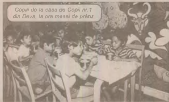
Copii de la casa de copii nr. 1 din Deva, la ora mesei de prânz