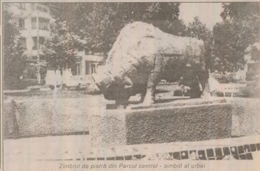
Zimbriul de piatră din Parcul central - simbol al urbei

În privința aspectului interior ar fi câte ceva de pus la punct. În urmă cu doi ani s-au adus unele îmbunătățiri în acest sens, adică mesele au fost "acoperite" cu sticlă și fețe de masă, dar între timp acestea s-au mai degradat. O igienizare totală trebuie să se facă și în acest an și se va face, cum spunea responsabilă cofetăriei.