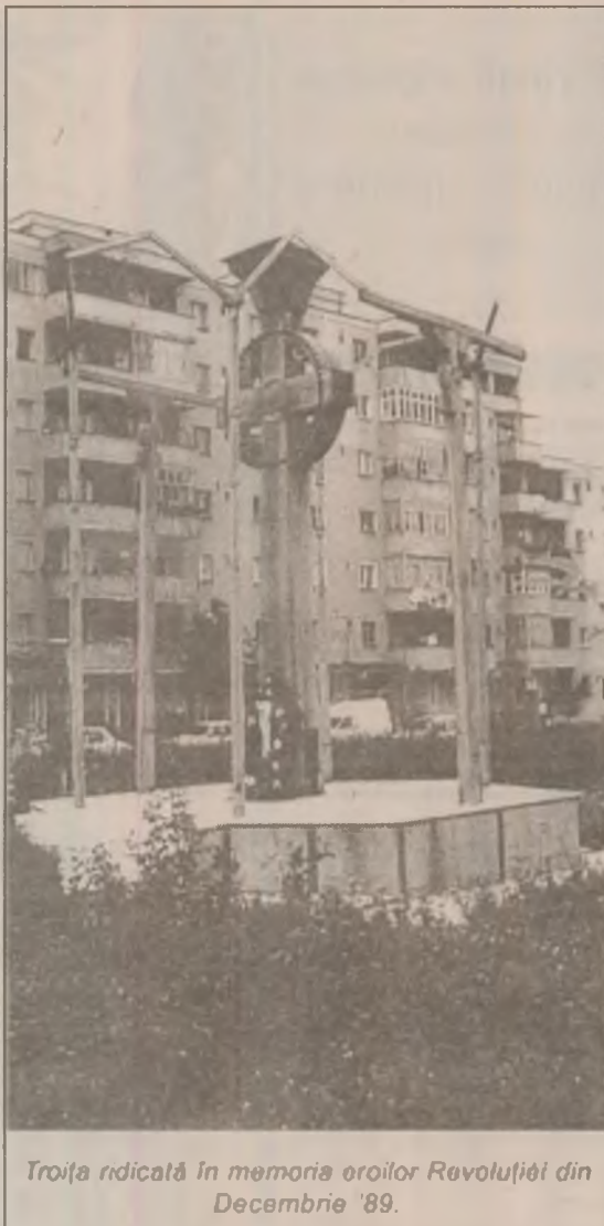
Troia ridicată în memoria eroilor Revoluției din Decembrie '89.

După cum aprecia, în planul-cadru care a venit se pune un accent puternic pe legătura cu părinții, pe opinia lor și mai cu seamă a elevilor în alegerea disciplinelor opționale. Încă în timpul anului școlar precedent a fost prezentat, într-o ședință cu părinții, noul plan-cadru, dar despre lista disciplinelor opționale nu se știa încă pe atunci, căci aceasta a venit acum. În ceea ce privește aplicarea acestor ultime noutăți, dna directoare era mai sceptică deoarece, spunea dumneaei, "e mai greu să-i adun pe părinți, copiii nu sunt la școală și eu trebuie să fac orarul până la 15 septembrie. În acest an s-ar mai putea face ceva dacă membrii consiliului de administrație vor lua legătura cu părinții, cerând opinia lor și a elevilor cam spre ce discipline ar dori să se orienteze pe lângă orele obligatorii prinse în trunchiul comun." Rămâne la latitudinea lor să se decidă. Dar pentru a le da timp de gândire, ar trebui găsită modalitatea de a li se comunica din timp.