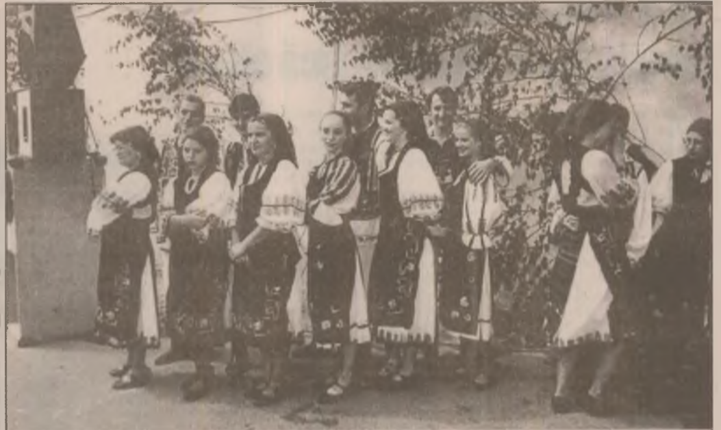
Fetele din Ansamblul folcloric "Getusa" Deva, înaintea intrării în scenă