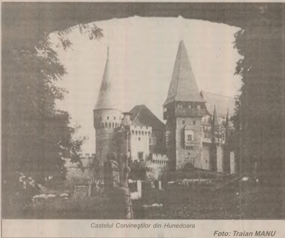
Castelul Corvineștilor din Hunedoara

O oră pe săptămână de accesare a Internetului reduce gradul de sociabilitate a utilizatorului și face în așa fel încât cercul de cunoștințe ale utilizatorului să scadă. Relațiile virtuale întreținute prin intermediul rețelei mondiale nu furnizează căldura, stabilitatea și optimismul pe care le dau cele reale, se mai arată în raportul HomeNet.