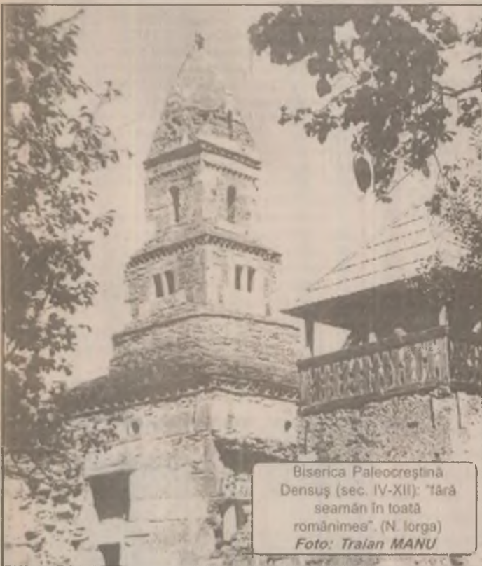
Biserica Paleocrestină Densuș (sec. IV-XII): "fără seamă în toată românimea" (N. Iorga)

Informații suplimentare la telefonul: 212927 sau 216792, interior 18, sau direct la sediul Camerei, la adresa menționată mai sus. (D.H.)