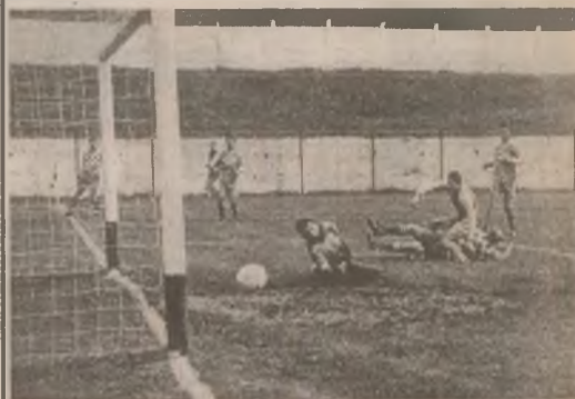
Faza din care Minerul Certej a egalat prin Rădoi.