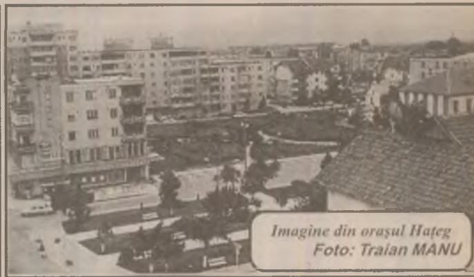
Imagine din orașul Hateg