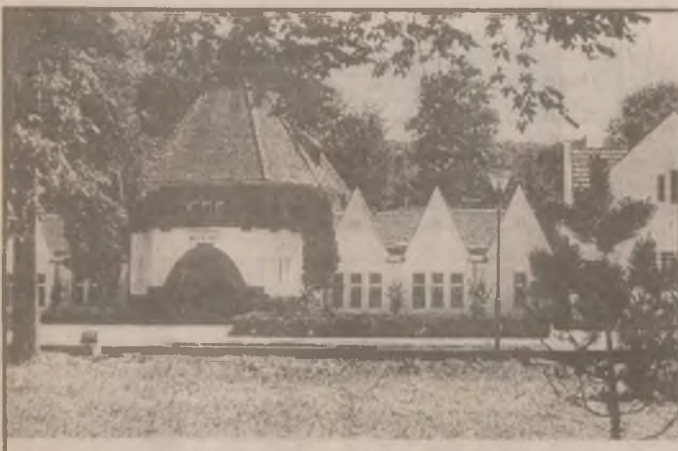
O ilustrată din stațiunea Vața-Băi.