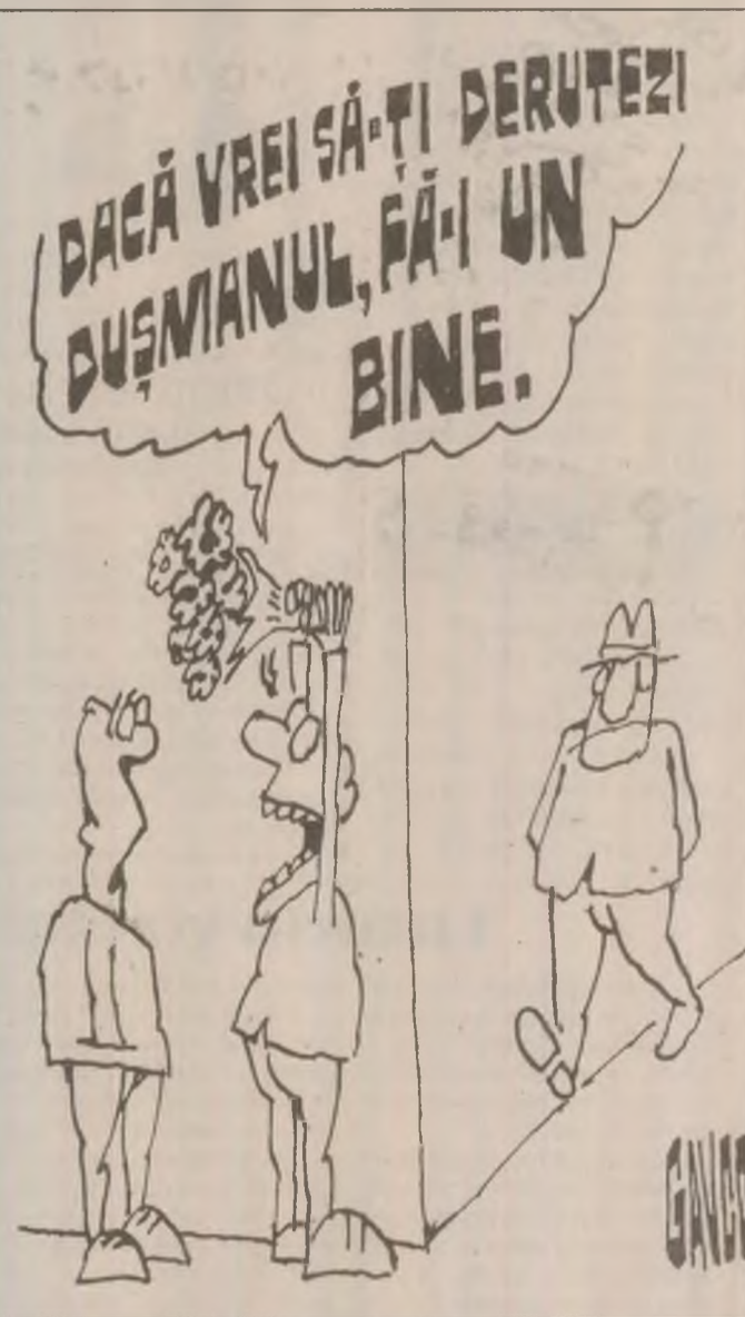
Pagină realizată de Valentin NEAGU, Ion CIOCLEI

Într-o perspectivă apropiată se are în vedere și reorganizarea activității judecătorești. Și acest lucru, întrucât sunt foarte multe cazuri în care hotărârile judecătorești se execută cu întârziere sau chiar nu se execută. Tocmai de aceea este nevoie de o accelerare a acestei faze a activității, mai ales că în executarea unor hotărâri judecătorești intervin motivații și interese care sunt dincolo de marginea legii.