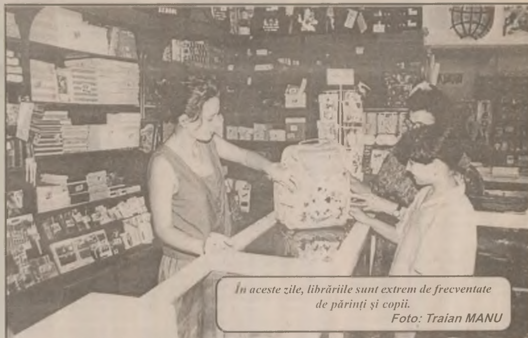
În aceste zile, librăriile sunt extrem de frecventate de părinți și copii.