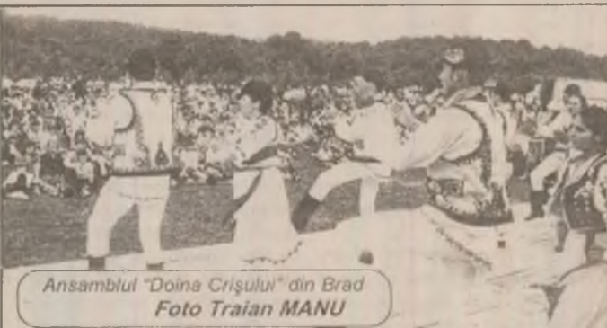
Ansamblul "Doina Crișului" din Brad