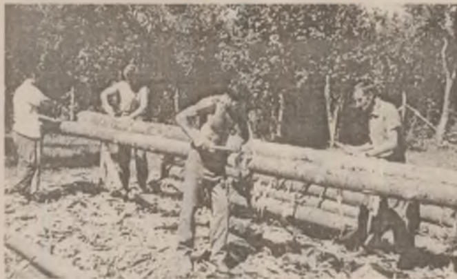
Se pregătește materialul lemnos pentru marea schelă ce va îmbrăca biserica din Densuș în vederea operațiunilor de reparații și restaurare.