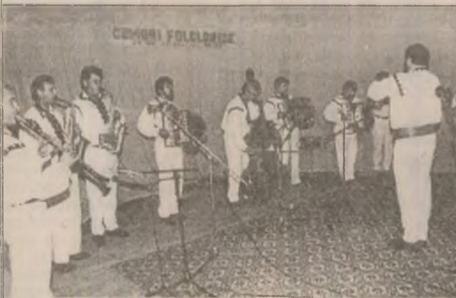
Taraful "Doina Crișului" din Brad, distins cu marele premiu al festivalului - concurs "Comori folclorice", ediția a V-a

Înainte spargerii SNCFR, la 1 octombrie a.c.,