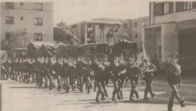
La festivitatea organizată cu prilejul Zilei pompierilor de Grupul de pompieri al județului Hunedoara au fost prezenți reprezentanți ai Prefecturii, Consiliului județean, ai unor instituții și societăți comerciale din județ.

Cele prezentate reprezintă o mică parte din activitatea noastră. Trebuie precizat faptul că aceste realizări nu ar fi fost posibile fără o strânsă cooperare și un sprijin real din partea Prefecturii, Consiliului județean, al celorlalte unități ale Ministerului de