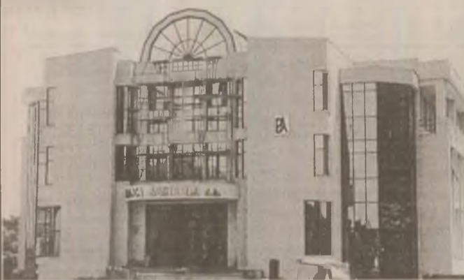
Noul sediu al Băncii Agricole S.A. - Sucursala coordonatoare Hunedoara - Deva

În context au fost aduse mulțumiri constructorilor și tuturor celor ce au participat la realizarea și dotarea cu tehnică modernă de calcul a noului sediu, între care sunt de amintit firme consacrate ca: Absolut Cominvest SRL Deva, Coloseum Slatina, AB-Baia Mare, Simako-Deva, Prima Telecom-Deva, Trans Electronic-Cluj Napoca, Covo Design-București, ale căror lucrări au întrunit aprecieri unanime. Deschiderea noului sediu oferă condiții din cele mai bune pentru ca aici prestațiile să se realizeze la nivelul standardelor celor mai ridicate în profil bancar. (N.T.)