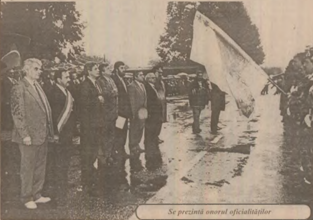
Se prezintă onorul oficialităților