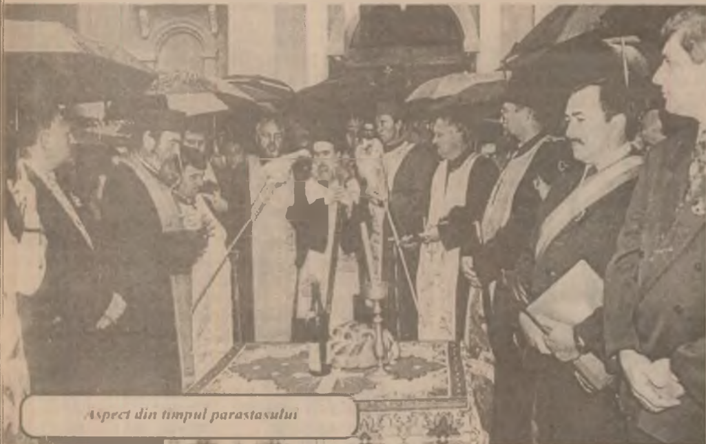
Aspect din timpul parastasului