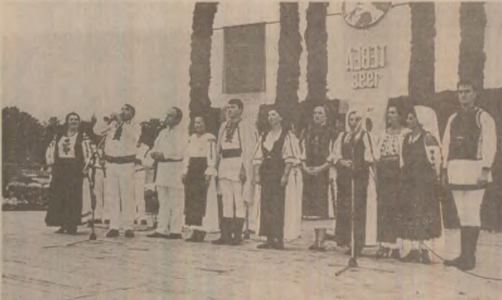
Soliștii hunedoreni în spectacol