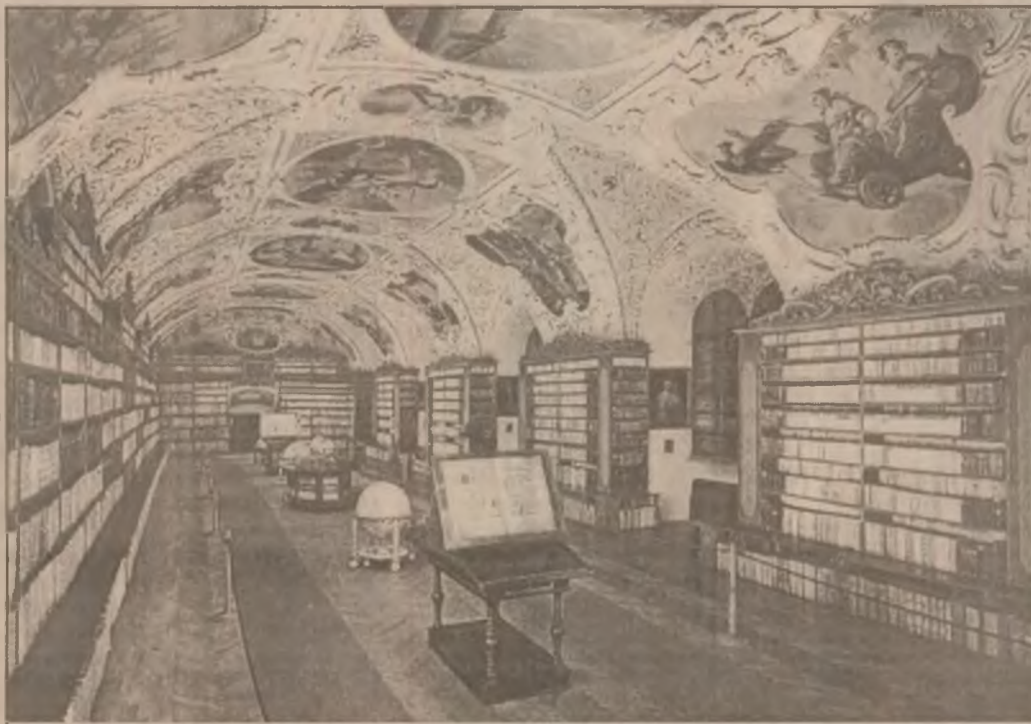
PRAGA - Sala teologică a Bibliotecii Strahov

Anul trecut, o manifestare similară consacrată lui Pablo Picasso a atras în muzeu o jumătate de milion de vizitatori.