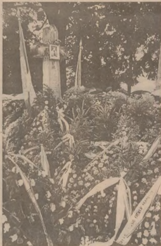
Mormântul lui Avram Iancu acoperit de coroanele depuse

Mulți dintre cei care au înfruntat ploaia la Tebea au fost surprinși de absența personalităților scenei politice românești. În consecință și cuvântările au fost puține, participanții reținând din mesajele transmise prin consilierii din partea președinției și a guvernului intenția dlui Constantinescu de „a se reculege la mormântul lui Avram Iancu și după ce nu va mai fi președinte”.