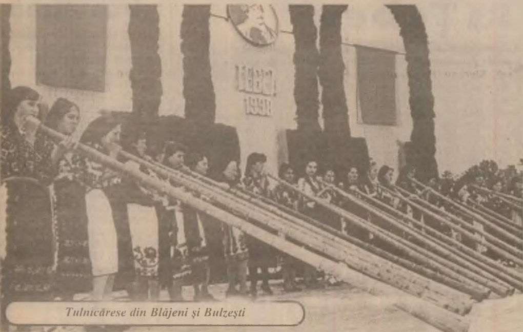
Tulnicărese din Blăjeni și Bulzești

ploaia mărunță și deasă câteva ore bune până să înceapă programul artistic; merite apreciate elogios de dna Marioara Murărescu, prezentatoarea spectacolului. La chemarea tulnicelor, asemeni înaintașilor, moții au umplut amfiteatrul natural din apropierea scenei.