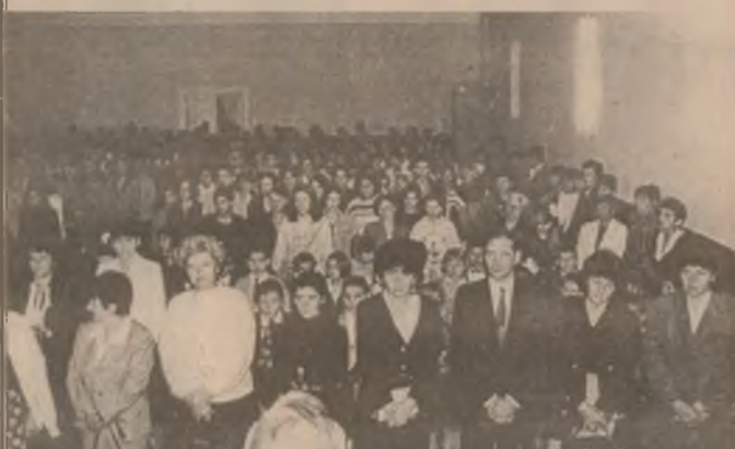
Aspect de la Festivitatea de deschidere a anului școlar desfășurată la Școala Normală "Sabin Drăgoi" din Deva.