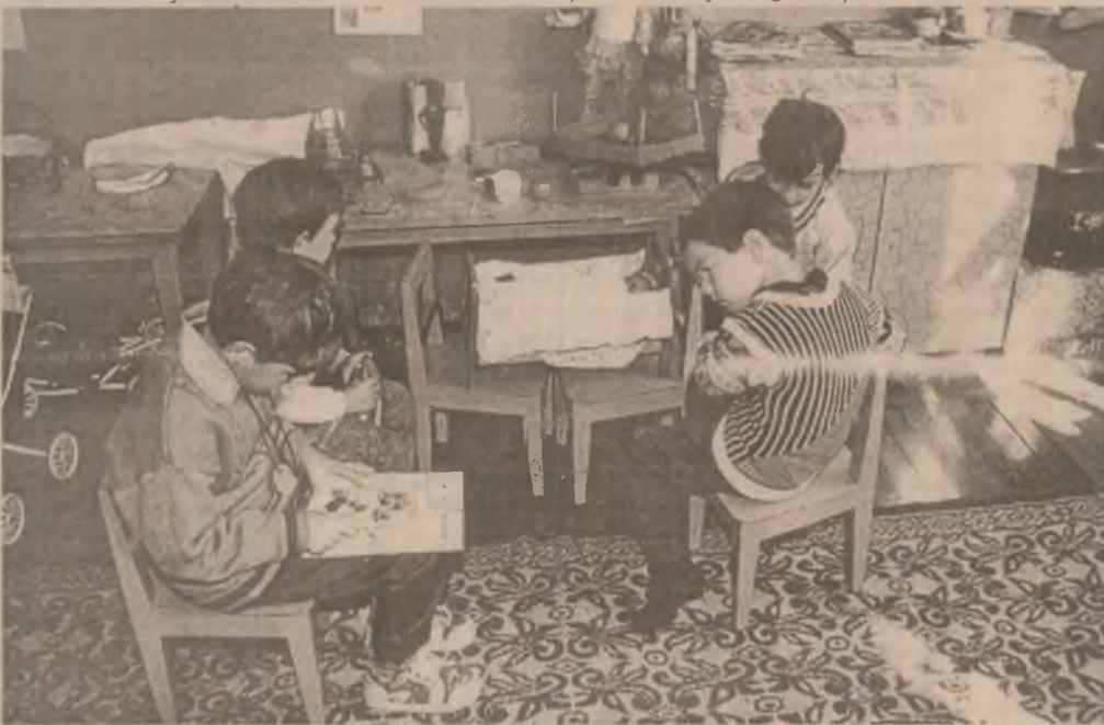
Cei mai nerăbdători copii "s-au prezentat" la grădiniță înaintea începerii anului școlar. Foto: Traian MANU

Pagină realizată de Esteră SÎNA, Viorica ROMAN, Georgeta BÎRLA, Nicolae TÎRCOB Foto: Traian MANU