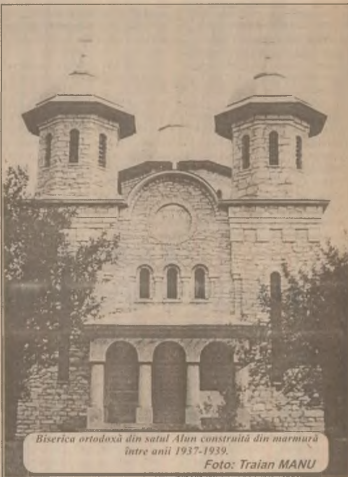
Biserica ortodoxă din satul Alun construită din marmură între anii 1937-1939.