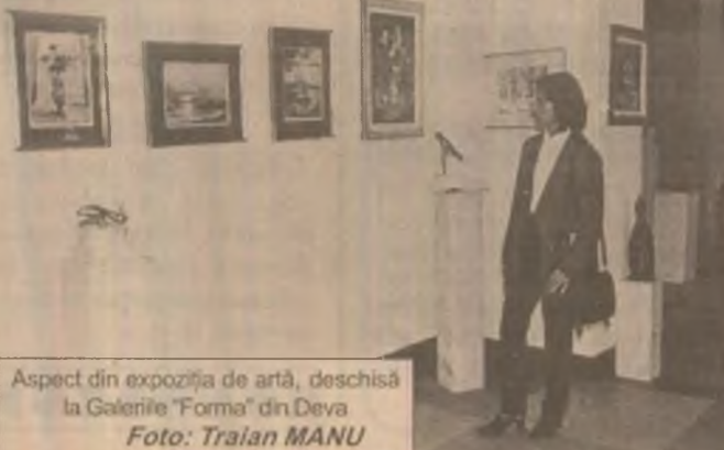
Aspect din expoziția de artă, deschisă la Galeria "Forma" din Deva