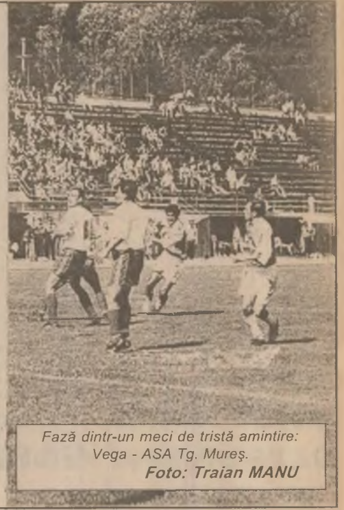
Fază dintr-un meci de tristă amintire: Vega - ASA Tg. Mureș.