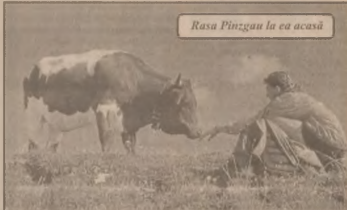
Rasa Pinzgau la ea acasă