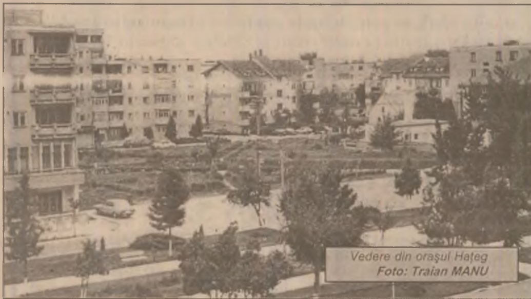
Vedere din orașul Hațeg

(Din Declarația conferinței de presă din 14.09.1998)