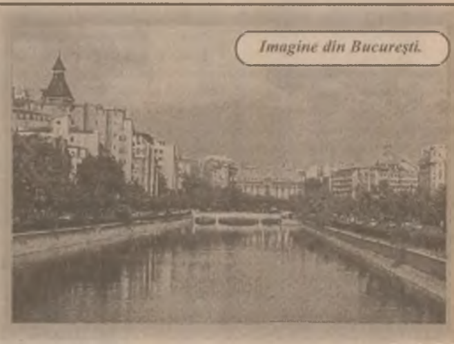
Imagine din București.

Din analiza făcută de Direcția Generală a Bugetului din MS pe semestrul întâi al anului 1998, rezulta că în primele luni s-au încasat aproape 34 la sută din restante, dar datoriile agenților economici continuă să rămână foarte mari. Aceasta deoarece fondul special de 2 la sută a devenit, potrivit Legii asigurărilor sociale de sănătate aplicabil de la 1 ianuarie 1998, de 5 la sută. Cele mai mari sume restante, la data de 30 iunie 1998, le aveau județele Hunedoara - 45,6 miliarde de lei, Municipiul București - 45,5 miliarde de lei, Galați - 34,09 miliarde, Gorj - 29,4 miliarde, Vaslui - 27,6 miliarde, Brașov - 22,1 miliarde de lei, a mai precizat directorul Negru.