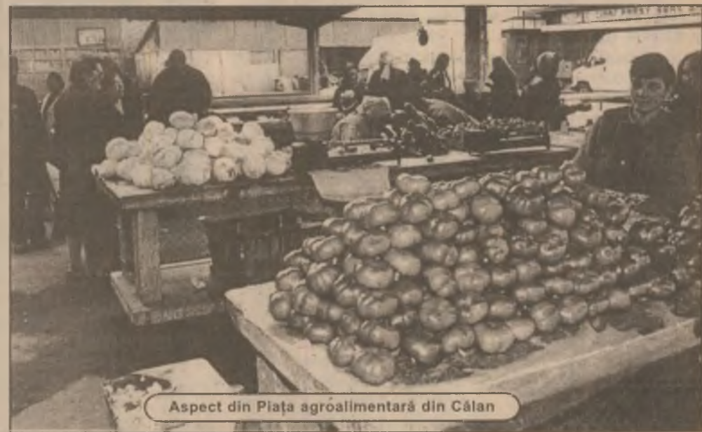
Aspect din Piața agroalimentară din Călan

- La prețurile și cantitățile vândute, nu câștigăm nici cât dăm pe transport sau cât cheltuim cu alte treburi.