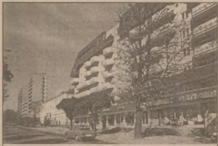
Petroșani - Imagine din zona centrală a municipiului

Ordonanța prevede, în plus față de Ordonanța de urgență 3/97, care reglementa aceeași problemă, ca Guvernul să fie informat asupra deciziilor Oficiilor Concurenței, iar în cazul unor "modificări structurale" ale costurilor, Executivul să avizeze modificarea prețurilor.