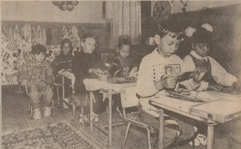
La primele ore ale dimineții, la Grădinița cu program normal nr. 1 Călan O.V. se desfășoară activități la libera alegere.