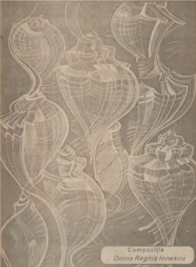
Compoziție Doina Regniș Ionescu