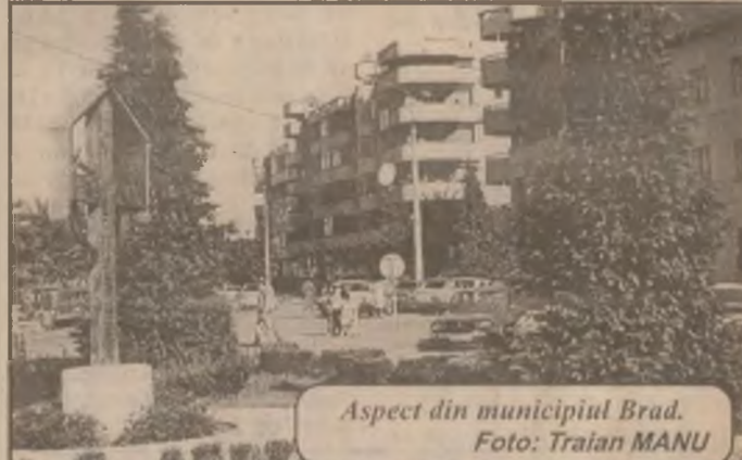
Aspect din municipiul Brad.

✱ la 30 de zile - 45% ✱ la 90 de zile - 47%