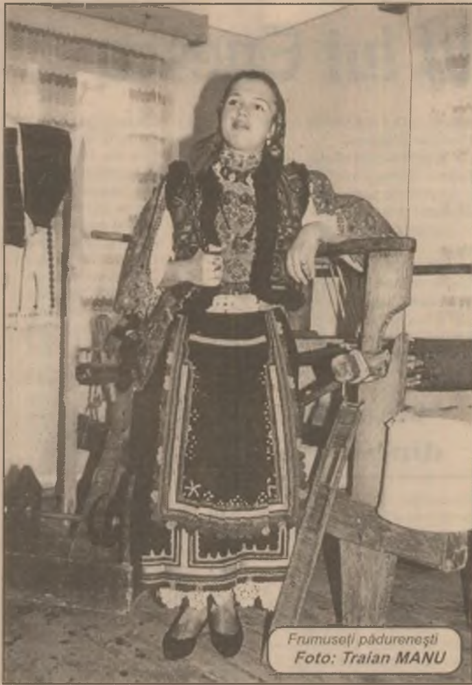
Frumuseți pădurenești

tume purtate de Bond în diverse ocazii, în diferite filme, încălțări, desuuri ale "fetelor Bond", postere, arme, fotografii. Mașina Lotus Esprit care condusă de Roger Moore în "The Spy Who Loved Me" se transforma în submarin, a fost vândută cu 46.670 de dolari. Mașina