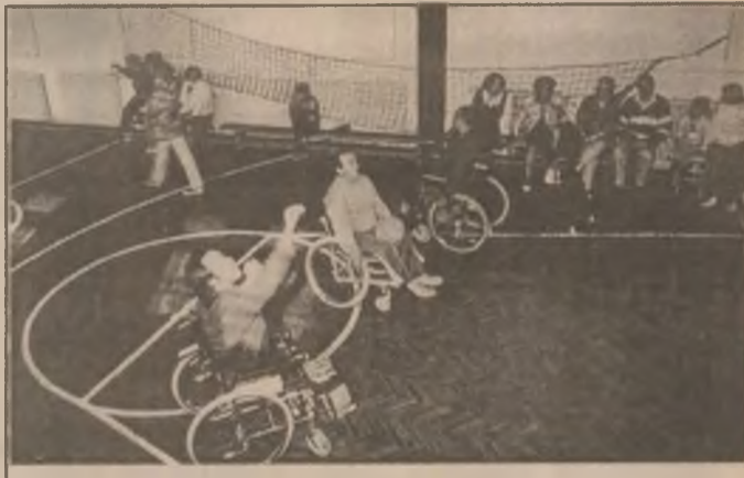
Moment din timpul concursului de aruncarea mingii la coș din cărucior

Întrecerile au fost disputate și s-au finalizat cu foarte mulți câștigători. Dat fiind numărul lor mare la toate genurile de concursuri, am reținut doar numele celor clasati pe locul I, dar felicitări merită toți participanții, pre-