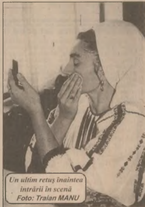
Un ultim rețuș înainte de intrării în scenă

În faza de debut al abceselor dentare se recomandă infuzie de flori de mușetel călduță care se ține în gură sau infuzie de frunze de salvie.