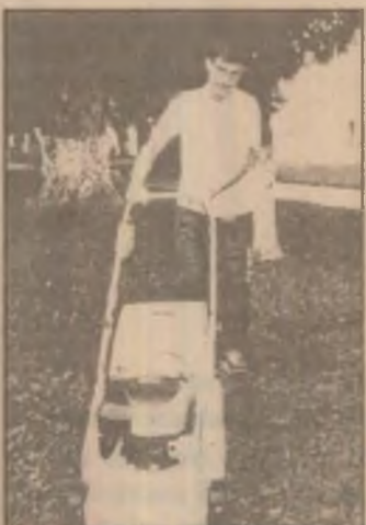
Primăria din Hațeg a primit recent o mașină de tuns iarba

Pagină realizată de Cornel POENAR, Traian BONDOR