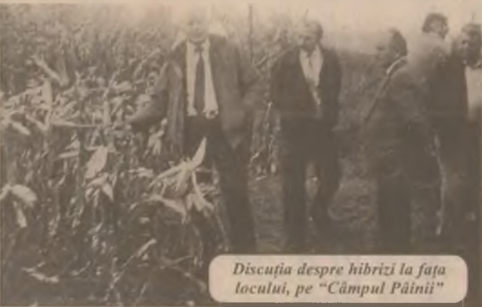
Discuția despre hibridi la fața locului, pe "Câmpul Pâinii"