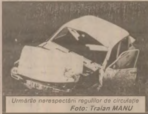
Urmările nerespectării regulilor de circulație

De precizat că, prin neplata taxelor legale către stat - Pompiliu Bota a cauzat un prejudiciu de 78.494.483 de lei.