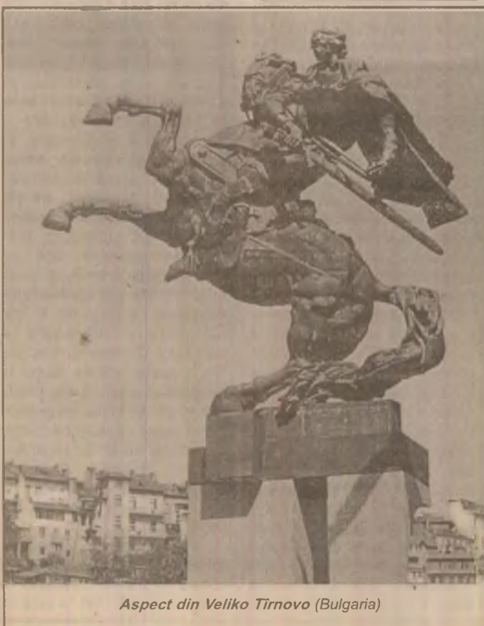
Aspect din Veliko Tirnovu (Bulgaria)

Semn al înnoirii timpurilor, lumea virtualului își face intrarea și la MIPCOM în acest an. Sectorul dedicat programelor soft audiovizuale, Mip Interactiv, pune la dispoziția amatorilor produsele pe baza MipInteractive.com.