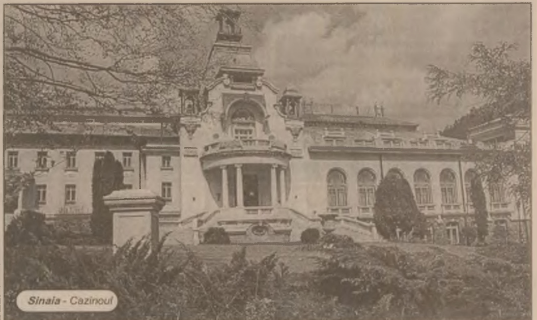
Sinaia - Cazinoul

Cinci biserici - coptă, armeană, greco-ortodoxă, latină (romano-catolică) și siriană - controlează câte o anumită zonă din biserică, iar o a șasea comunitate, cea etiopiană, ocupă o aripă din partea de răsărit a bisericii. Întrucât există dezacorduri între aceste comunități, autoritatea civilă israeliană a luat inițiativa efectuării unor reparații. Recent, autoritățile israeliene au acoperit costurile reparației a trei arcade ale unei capele din extremitatea vestică, disputată de sirieni și armeni.