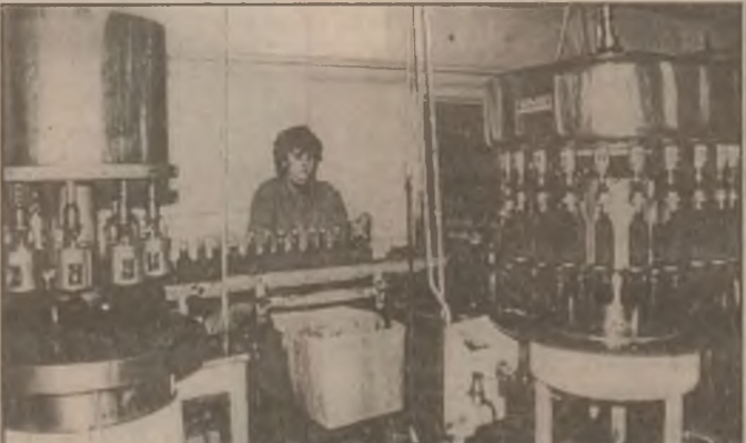
Linia de îmbutellare a lichiorurilor la Chiquita SRL Orăștie este supravegheată cu atenție pe fiecare schimb de către personal calificat