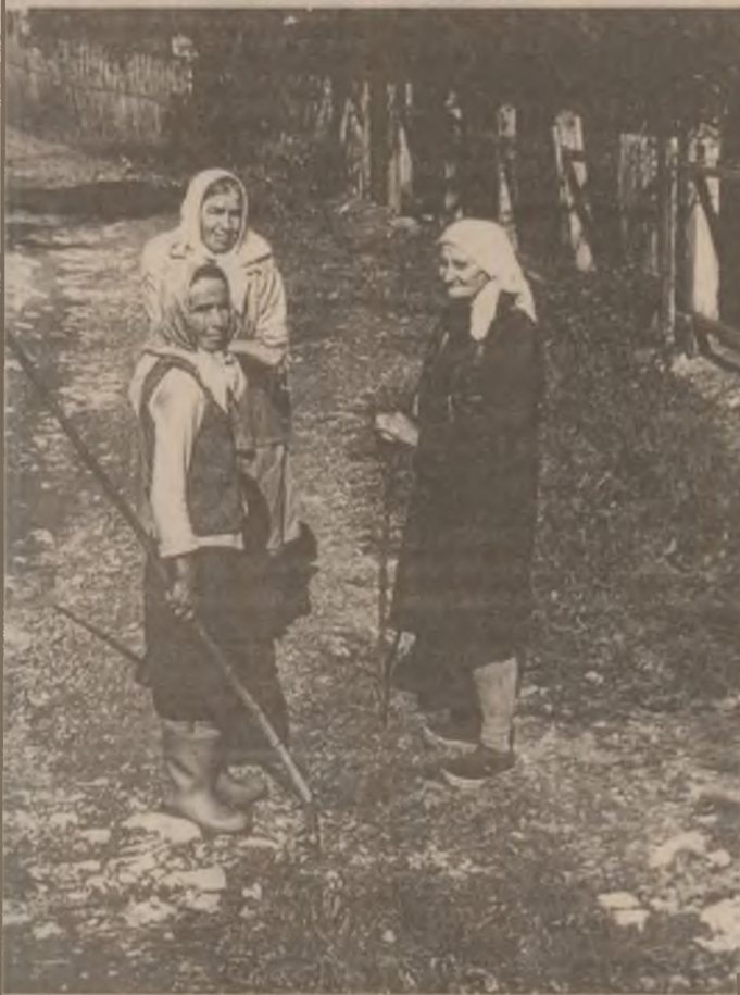
Ai auzit, nană, au venit ziaristi de la "Cuvântul liber"!