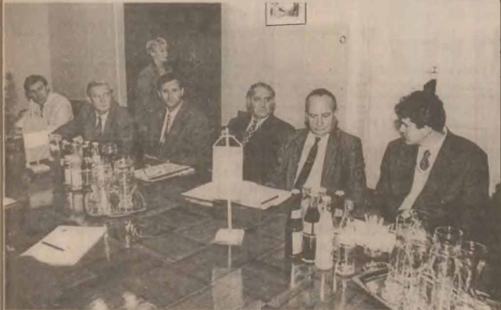
Aspect din timpul desfășurării conferinței de presă.