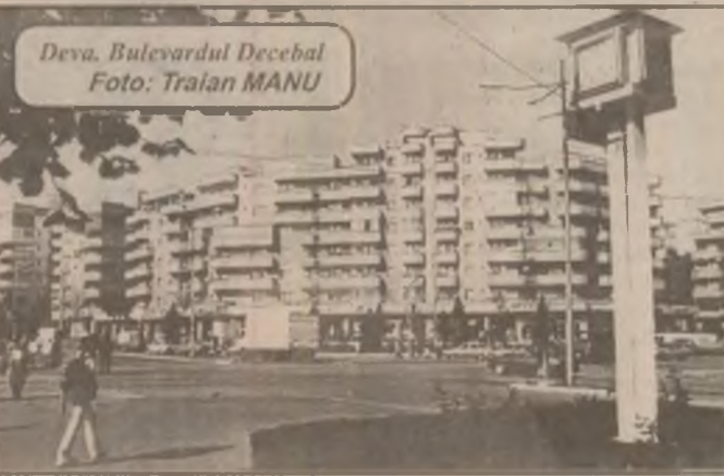
Deva, Bulevardul Decebal

Dacă nu se ajunge la o negociere corespunzătoare cu guvernul, protestul personalului din învățământ va continua marți, 27 oct., cu o grevă generală. (G.B.)