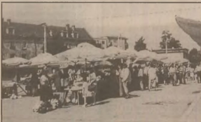
Piața agro-alimentară din Simeria se prezintă cumpărătorilor în mod curat și civilizat.

Statistica operează cu cifre. Ea ar trebui să fie imparțială, să nu țină seama de politică și mai ales de cine se află la putere. Altfel ajungem la concluzii ca acelea de pe vremea împușcatului, când producțiile agricole, de exemplu, creșteau amețitor, dar nu în realitate, ci doar ...în comunicatele statistice.