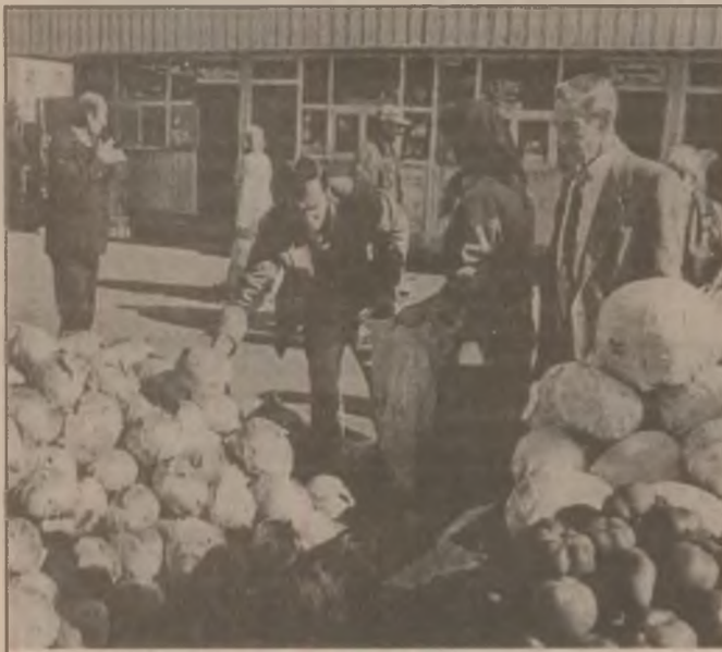
Dacă a venit toamna, a început și sezonul murăturilor. Varza are deja căutare pe piața din Deva.

Aducând acuze aspre actualei coaliții aflate la putere pentru situația grea în care a ajuns țara, pentru prăbușirea drastică a nivelului de trai și a speranțelor românilor spre mai bine, Declarația aduce critici aspre Președinției și Guvernului învinuindu-le de nepricepere, de servilism în fața organismelor internaționale, de trădarea intereselor țării. În finalul documentului se afirmă: "Respingând orice compromis care pune în pericol unitatea și integritatea național-statală a României, declarăm solemn că nu vom îngădui nimănui să ne cuntescă trupul țării, că Transilvania este și va fi mereu parte integrantă și inseparabilă a acestui trup numit România." (Tr.B.)