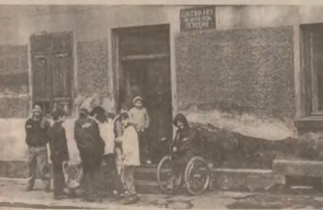
Cu mult timp înainte de ora distribuției mâncării, beneficiarii Cantinei de ajutor social nr. 1 din Petroșani așteaptă mâncarea pentru ei și familiile lor.

O clădire modestă în colonia de jos, din spatele gării, a Petroșaniului. Pe fațadă scrie simplu, cu litere modeste: Cantina nr. 1 de ajutor social. De fapt este nr. 1 și singura de acest fel din municipiu. Lângă ușa de la intrarea din stradă - o bătrână imobilizată într-un cărucior.