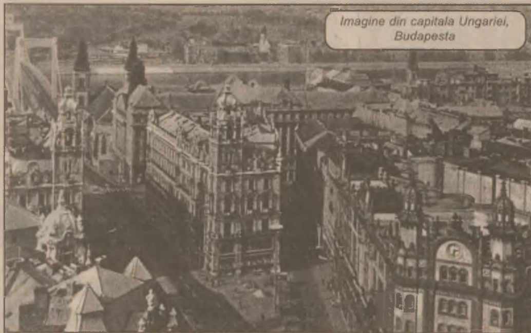
Imagine din capitala Ungariei, Budapesta

Toate persoanele juridice menționate în lege au obligația să stabilească identitatea clientului pentru orice tranzacție care depășește 10.000 ECU.