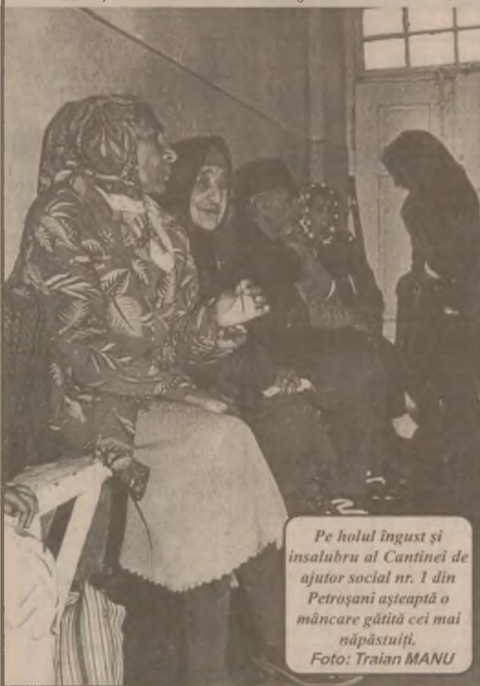
Pe holul îngust și insalubru al Cantinei de ajutor social nr. 1 din Petroșani așteaptă o mâncare gătită cei mai săracii.

Sărăcie mare în țară. Aproape 30 la sută din populația României trăiește în sărăcie. Pentru diminuarea acestui fenomen se fac o serie de eforturi, însă bătlia se anunță lungă și anevoioasă. Recent, șeful statului spunea că „lupta împotriva sărăciei este o provocare națională”, însă atâta timp cât starea economiei este atât de precară, sărăcia nu va putea fi ameliorată. Încearcă s-o mai atenueze cumva Fondul Român de Dezvoltare Socială, cu sprijinul Băncii Mondiale, care are un program de combatere a sărăciei în întreaga lume.