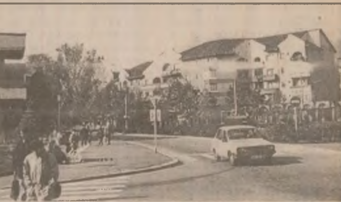
Imagine din Orăștie

2386 Ilia - Simeria; 2664 Periam - Timișoara Nord; 2684 Sănnicolau Mare - Timișoara Nord (toate între 31 octombrie și 8 noiembrie) și 2671 Timișoara Nord - Periam; 2691 Timișoara Nord - Sănnicolau Mare (în perioada 30 octombrie - 7 noiembrie). (V.R.)