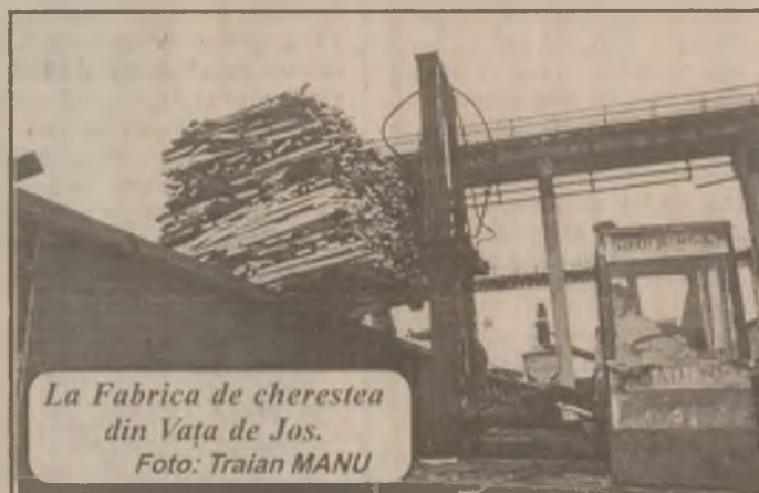
La Fabrica de cherestea din Vața de Jos.

toate țările vecine României. Proprietarii de case, de pământuri, de alte bunuri trebuie să reintre în posesia lor. Este o componentă a democrației. Însă dacă tot am rămas în urma timpului, trebuie să înțelegem că nu acestea constituie cu adevărat, la această oră, obiectivele principale ale reformei în România. Ele sunt altele, mult mai importante și mai necesare. Sunt privatizarea, descentralizarea administrativă, echilibrarea sistemului financiar și fiscal, consolidarea instituțiilor democratice, protecția socială a populației. Pentru acestea, în primul rând, membrii coaliției trebuie să găsească înțelegere unii la alții, să arunce peste bord orgoliile și interesele meschine și să dea țării, populației, legile de care este cea mai mare nevoie, pentru binele general al națiunii.