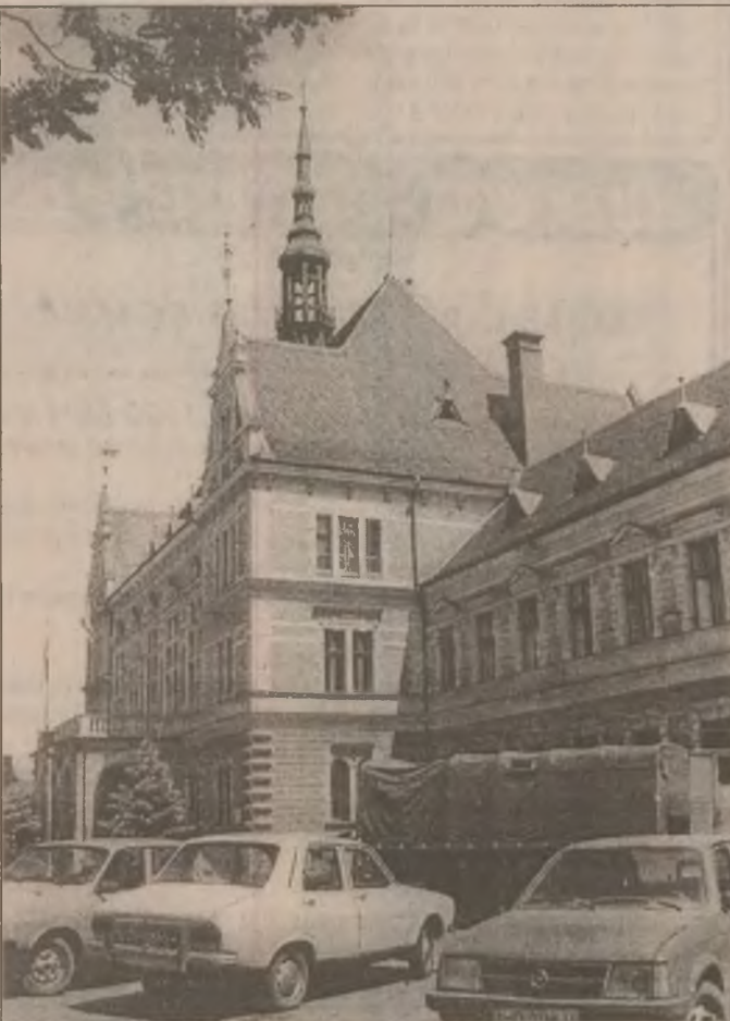
Clădirea Prefecturii Județului Hunedoara

O amplă acțiune de deratizare se va declanșa în Deva începând din primele zile ale lunii noiembrie ce vizează în primul rând combaterea șobolanilor. Prin acțiunea de deratizare se vizează locurile de depozitare a gunoaielor, subsolurile blocurilor și zona containerelor. Pentru a se preveni unele evenimente nedorite autoritățile locale îi avertizează pe cei care scormonesc în gunoaie după resturile menajere și care ulterior le dau animalelor.