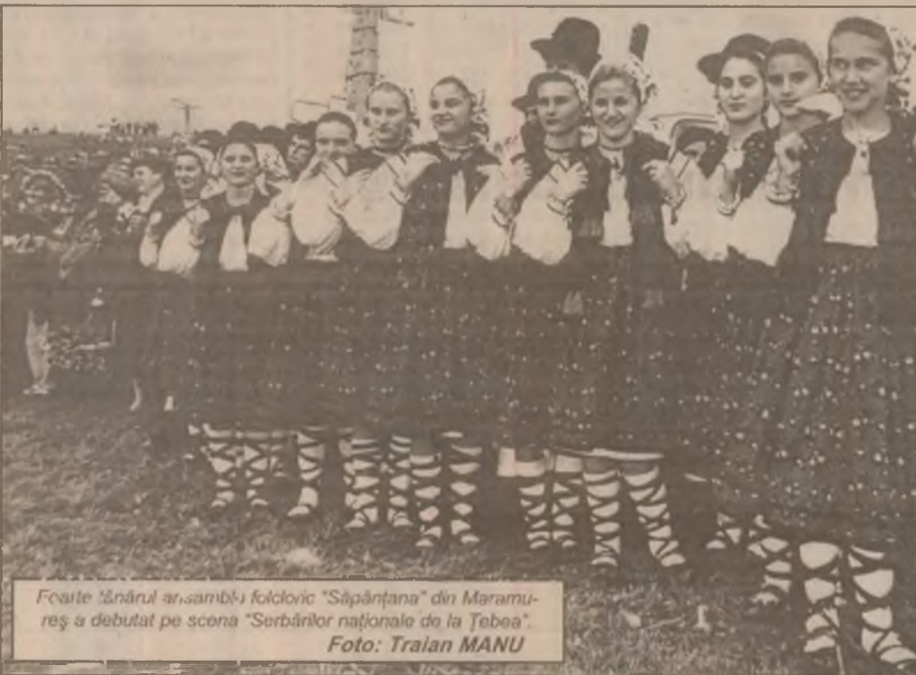
Foarte tânărul ansamblu folcloric "Săpânțana" din Maramureș a debutat pe scena "Serbărilor naționale de la Tebea".

Documentul care prevede felul în care această înlesnire va fi aplicată a fost elaborat de echipa ministrului Educației, Andrei Marga, deși ea fusese reintrodusă în Legea învățământului încă din 1995.