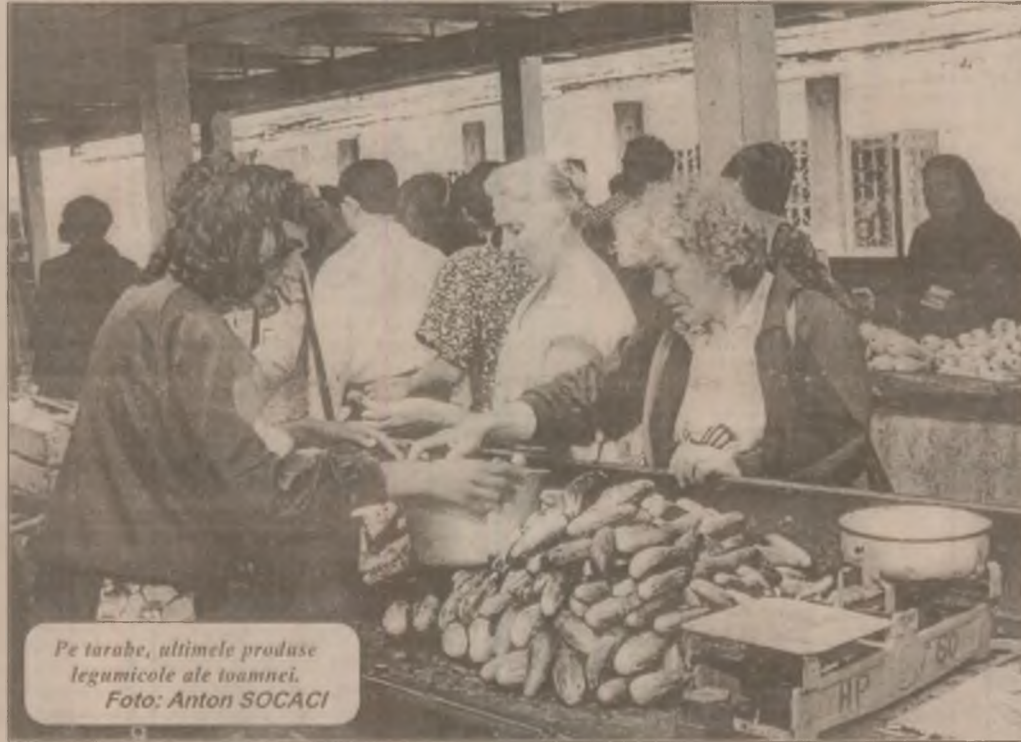
Pe tarabe, ultimele produse legumicole ale toamnei.

Mărfurile românești se vor livra în trimestrul IV 1998 - semestrul I 1999, iar gazele naturale în compensație se vor importa în trimestrul IV 1999. În același timp, se vor asigura mijloacele financiare necesare care să dea posibilitatea operatorilor economici români să încaseze contravaloarea în lei a mărfurilor la livrare. (Mediafax)