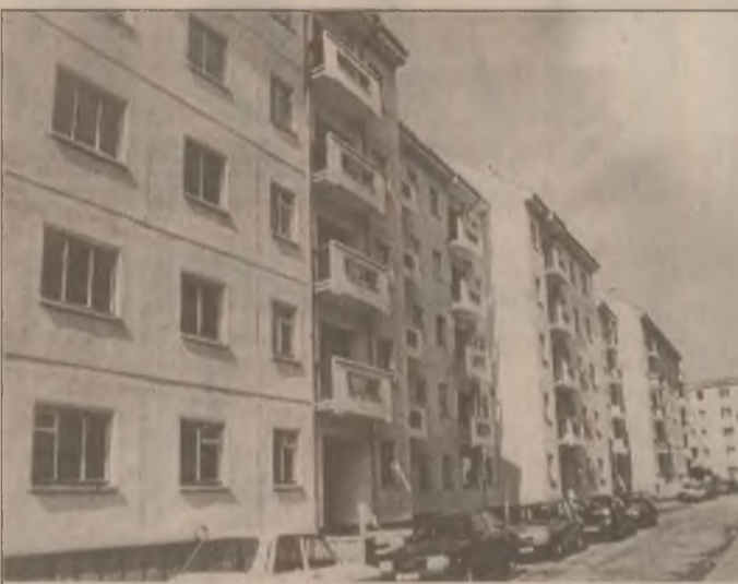
Blocul de pe strada Mărășești din Deva dat în folosință recent

Pe lângă obiectivele nominalizate a se realiza la Abrud, Moldova Nouă, Bălan, Roșia Montană și Zlatna - toate din cadrul RAC Deva, sunt susținute și investițiile necesare la E.M. Certej și Bolcana - Deva. (N.T.)