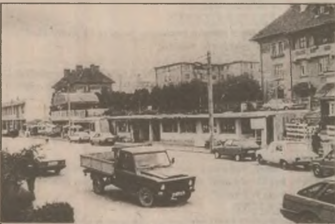
Zona Gării CFR din oraș a fost pur și simplu invadată de zeci de chioșcuri mai mult sau mai puțin arătoase, mai mult sau mai puțin căutate de cumpărători. Majoritatea sunt de desfacere a băuturilor alcoolice.

Din bugetul pe acest an - subțire așa cum este - s-a alocat suma de 400 milioane lei - tot atât cât s-a alocat noii case de cultură - pentru începerea lucrărilor de introducere a apei și a canalizării satului Sîntandrei. La cele scrise până acum să adăugăm reparațiile făcute la toate școlile și căminele culturale de pe sate și avem dovada atenției de care se bucură localitățile rurale ale Simeriei.