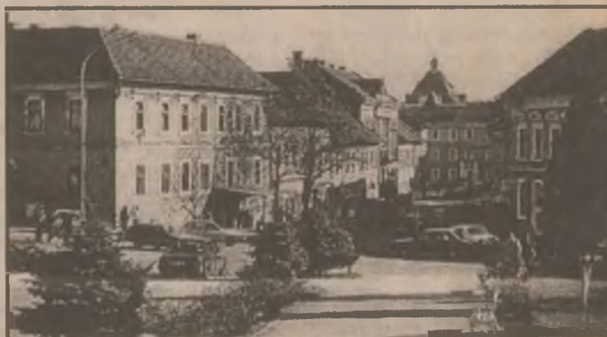
Orăștie. Centrul vechi al orașului