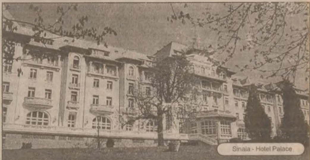
Sinaia - Hotel Palace