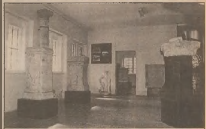
Aspect din una dintre sălile Muzeului de istorie din Sarmizegetusa