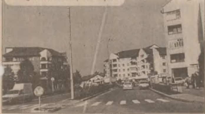
Imagine din municipiul Orăștie

În același timp se va moderniza capacitatea de producție, se va informatiza fluxul tehnologic astfel încât în urma unor programe ce vizează mai multe tipuri de utilaje și mașini agricole uzina a proiectat la Institutul francez de mașini și echipamente agricole prima mini-combină de cereale din țară care va fi prezentă la târgul de specialitate INDAGRA care are loc în acest an. Întregul pachet investițional care va fi promovat la Uzina Mecanică deschide cel puțin pe moment o șansă pentru viața locuitorilor și așa lovită crunt de sărăcie, șomaj și multe alte greutăți și nu în ultimul rând perspectiva unui loc de muncă.