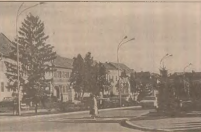
ORĂȘTIE - Aspect din centrul municipiului, cu celebra lucrare în marmură "Palia", realizată de sculptorul Nicolae Adam