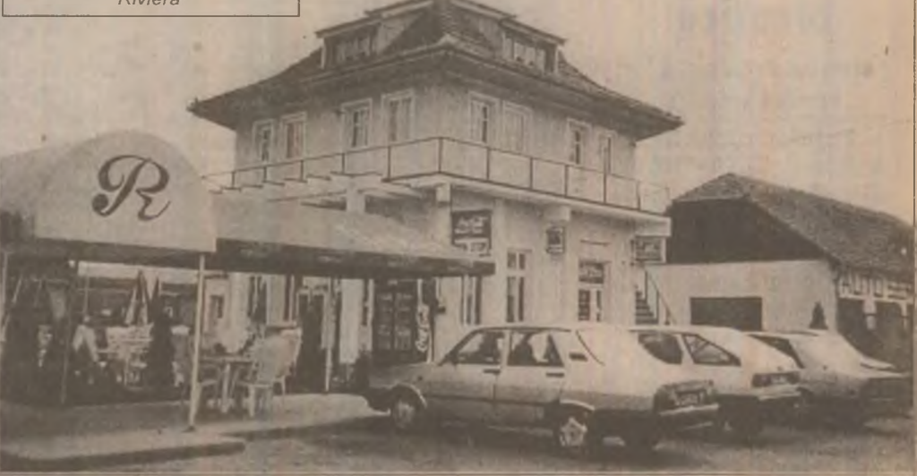
Bună servire, eleganță, bun gust