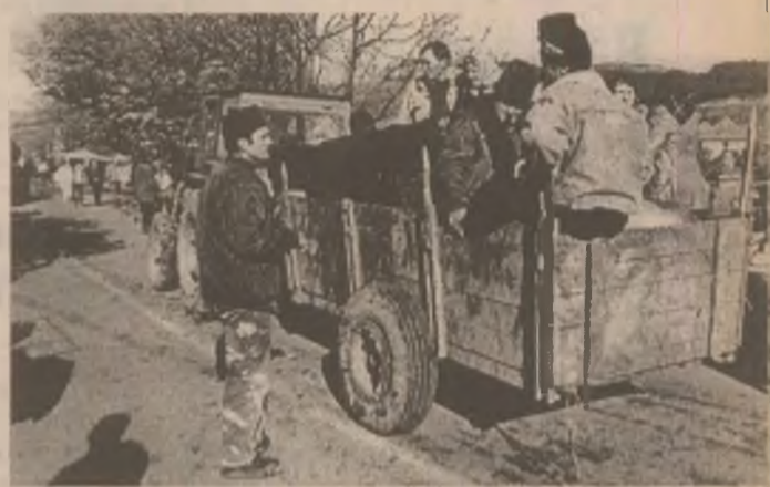
De la târgul din Geoagiu se pleacă cum se poate și cu ce se poate.

Către ora 14 se sparge târgul. Se adună mărfurile și se