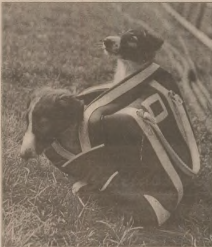
Sistem de alarmă și pază la purtător!