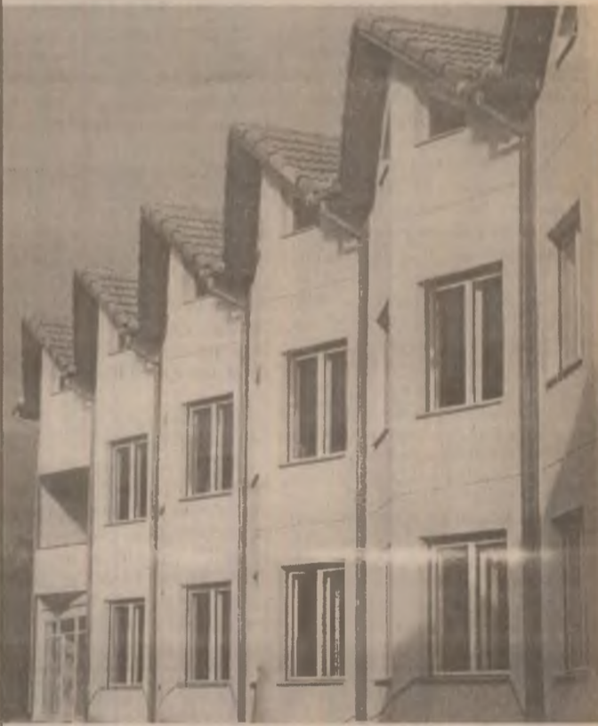
Vedere exterioră a noului sediu al Camerei de Comerț și Industrie a județului Hunedoara.