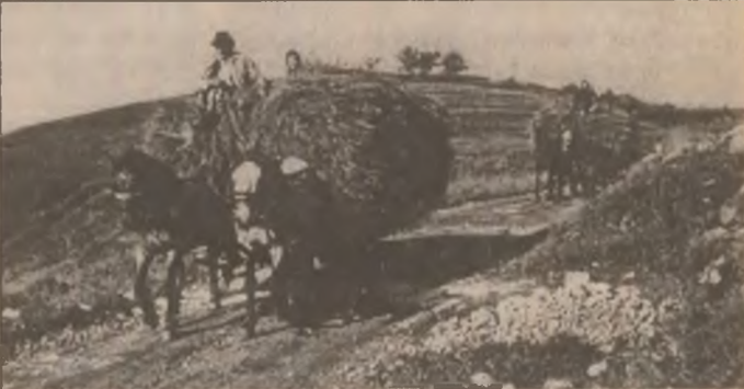
Harnicii pădureni se îngrijesc de hrana animalelor pentru iarna care vine.