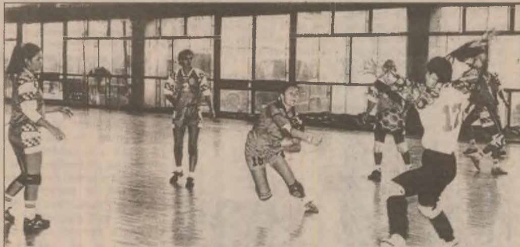
Fază din meciul de handbal U. Remin Deva - Famos Odorhei

În meciul de Cupă din etapa trecută UNIREA VEȚEL - CASINO ILIA 3-2.