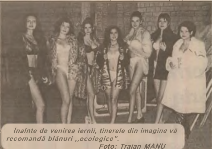
Înainte de venirea iernii, tineretele din imagine vă recomandă blănuri „ecologice”.