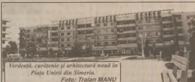
Verdețată, curățenie și arhitectură nouă în Piața Unirii din Simeria.

Poate că economiștii vor găsi o soluție mai simplă la această problemă, prin care barterul să fie profitabil pentru toți cei implicați în el. Altfel ne întorcem la lecția Bancorex care a finanțat cu ani în urmă factura petrolieră a țării și mulți ani după aceea nu-și mai putea recupera banii iar ce-a urmat se știe.