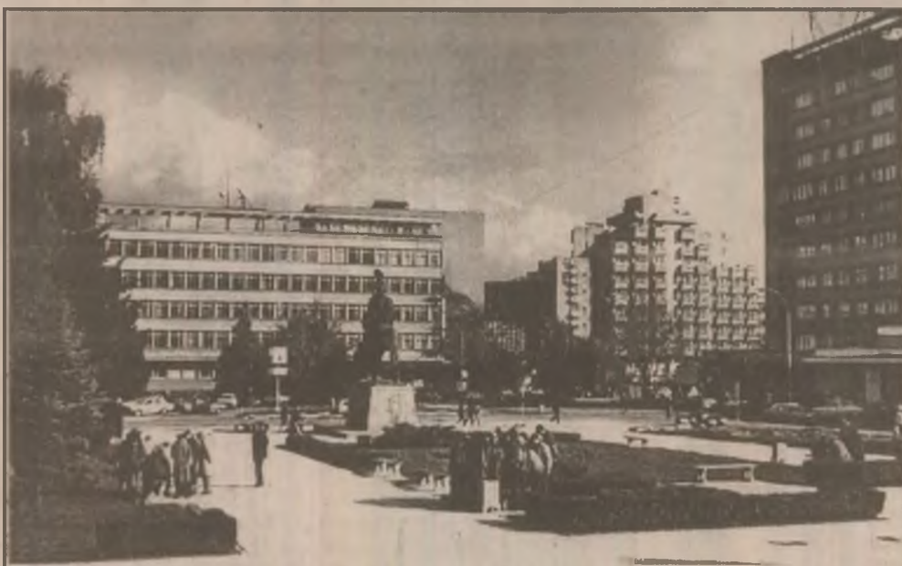
Deva. Piața Victoriei, unde șahiștii amatori au locurile lor.