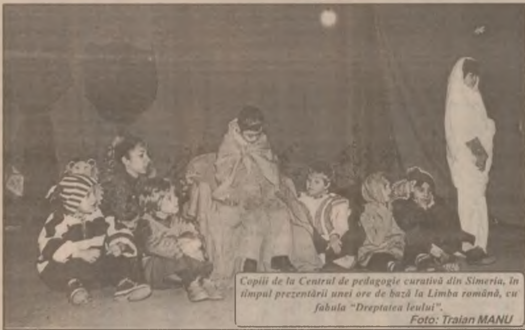
Copiii de la Centrul de pedagogie curativă din Simeria, în timpul prezentării unei ore de bază la Limba română, cu fabula "Dreptatea leului".