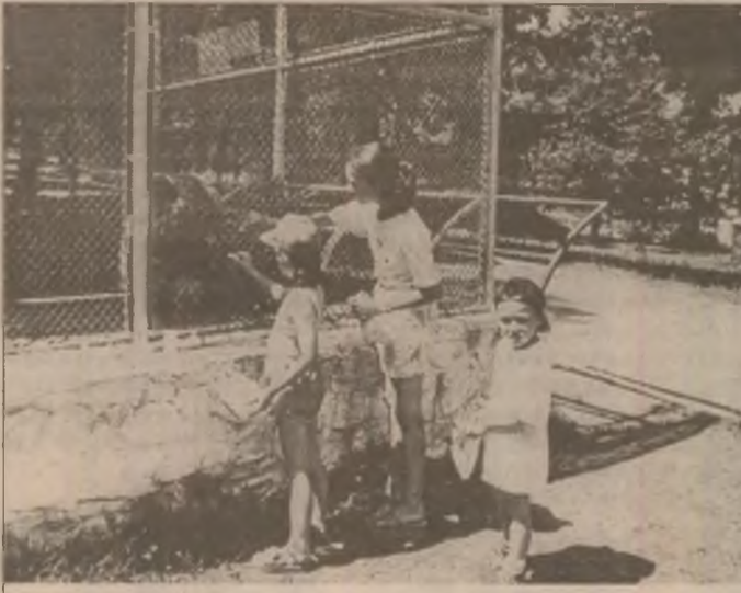
HUNEDOARA - Copii în vizită la animalele preferate de la parcul Zoo de la "Ciuperca"

Se vede de departe că se dorește și se face un lucru trainic.