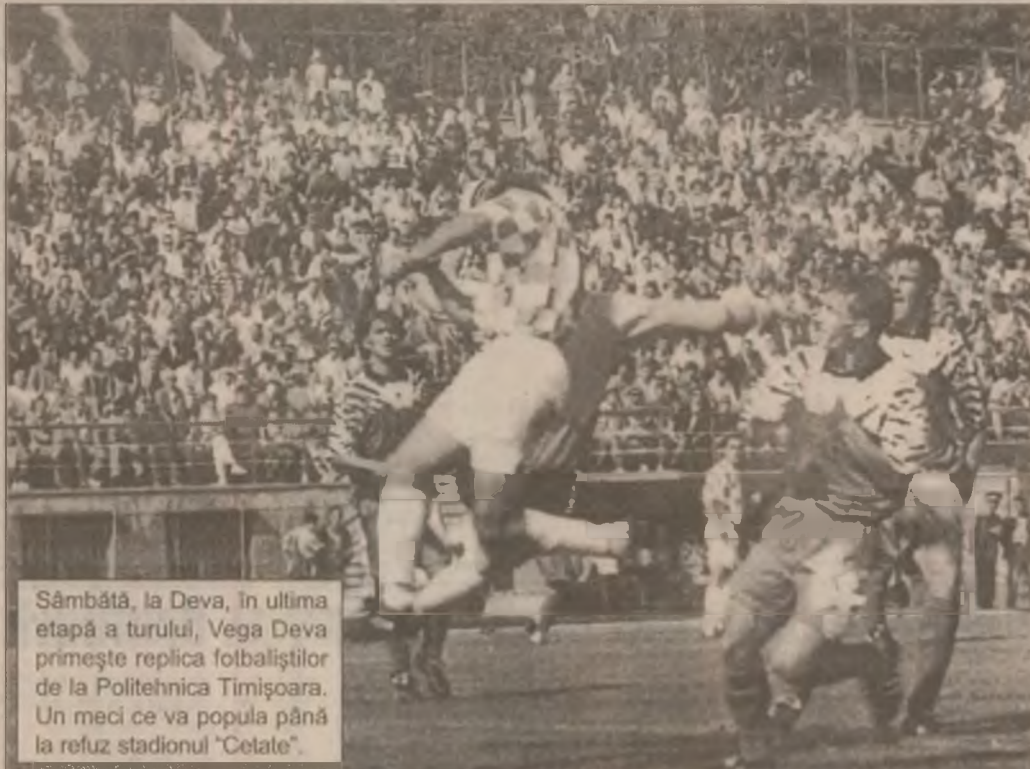
Sâmbătă, la Deva, în ultima etapă a turului, Vega Deva primește replica fotbaliștilor de la Politehnica Timișoara. Un meci ce va popula până la refuz stadionul "Cetate".