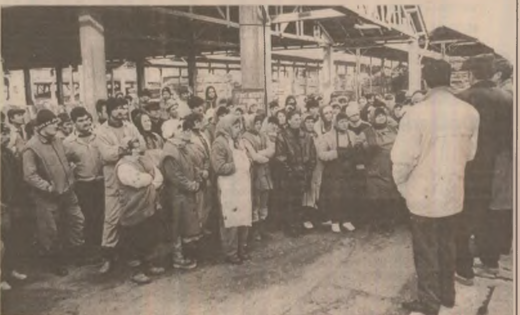
Angajații de la Secția de Industrializare a Lemnului Orăștie s-au aflat în grevă. Spectrul iernii și al șomajului îi duce la disperare.