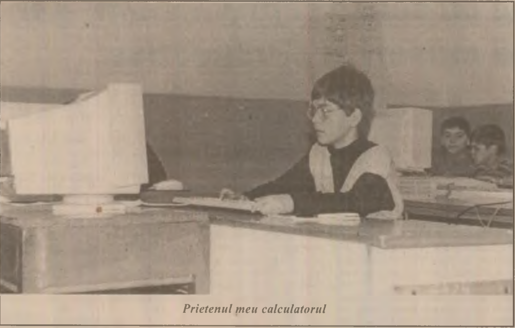
Prietenul meu calculatorul