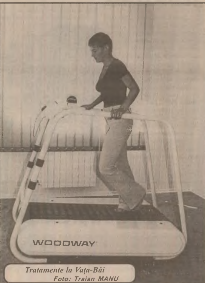
Tratamente la Vața-Băi

Umbrelele trebuie mănuite cu multă grijă pentru a nu lovi cu marginea lor persoanele din jur. Atenție, să nu lăsăm apa să curgă de pe "streașina" umbrelei pe hainele cuiva. Când intrăm într-o casă, umbrela este strânsă și așezată într-un ungher, cu consimțământul gazdei o putem deschide pentru a se usca. Dacă în timp ce plouă, întâlnim un prieten îi oferim protecția umbrelei chiar dacă niscăm să fim ușor udați.