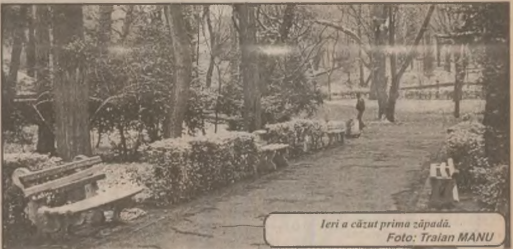
Ieri a căzut prima zăpadă.