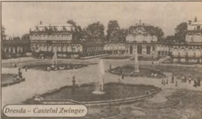
Dresda - Castelul Zwinger

Trecerea anului 2000 va perturba computerele, care nu identifică decât ultimele două cifre ale anului și riscă identificarea cu 1900 sau blocajul, costul unei adaptări la nivel mondial necesitând între 300 și 1.600 de miliarde de dolari.