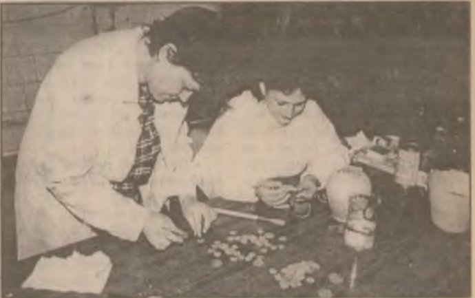
Monedele tezaurului de la Pui sunt acum obiectele de lucru ale restauratoarelor muzeului județean.

* la 30 de zile - 51% * la 90 de zile - 53%