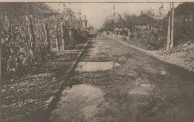
Deși se fac eforturi de către Primărie pentru repararea străzilor, sunt locuri unde imaginile spun totul - strada Viața Nouă și Mihai Eminescu fiind doar două exemple. Lipsa banilor își spune din plin cuvântul!

dene ne-au mărturisit că problema este cunoscută, însă nu există fondurile necesare pentru demararea reparațiilor. Poate la anul!