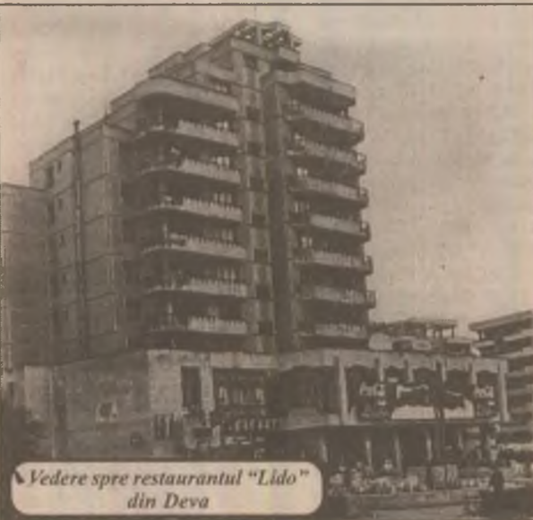
Vedere spre restaurantul "Lido" din Deva