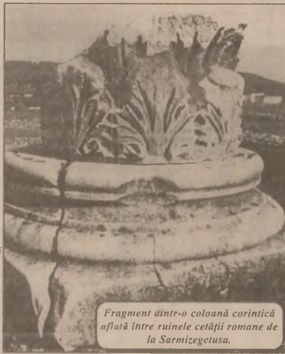
Fragment dintr-o coloană corintică aflată între ruinele cetății romane de la Sarmizegetusa.