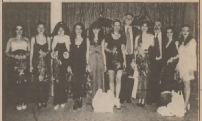
Finalistele concursului MISS BOBOC ECO '98