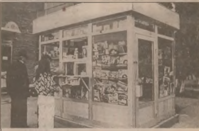
La acest elegant chioșc amplasat lângă Magazinul “Palia” din Oraștie, vă puteți procura zilnic ziarul “Cuvântul liber”, dar și presă centrală și produse de strictă necesitate. Puteți beneficia, de asemenea, de servicii de mică publicitate prompte, evitând drumul până la Deva.