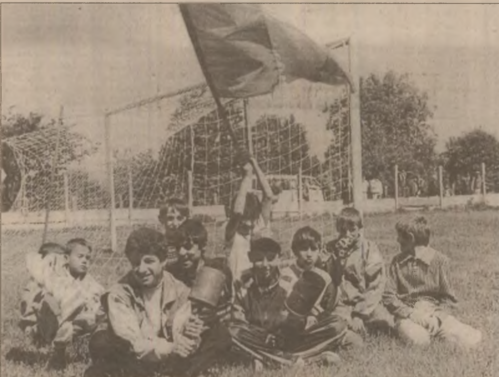
Copiii, cei mai înfocați suporterii, se constituie în galerii tot mai apreciate pe stadioanele județului nostru