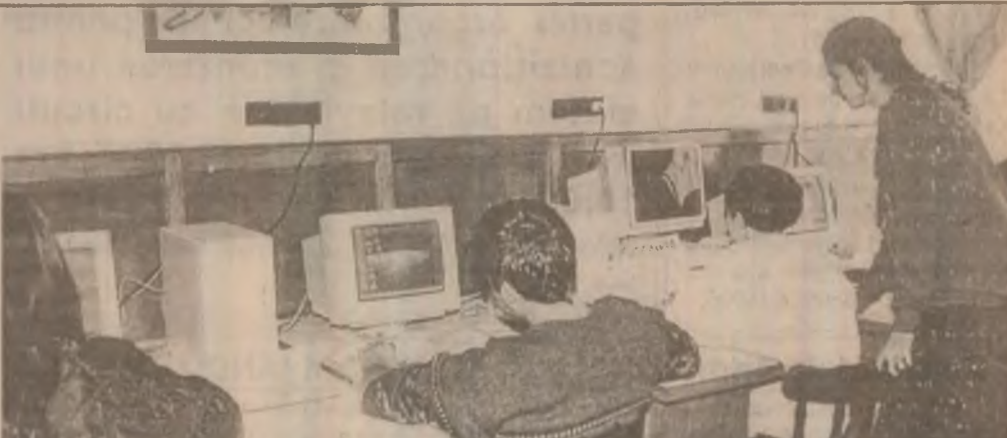
Liceul teoretic "Traian" din Deva. Clasa a X-a studiază în sala de informatică.