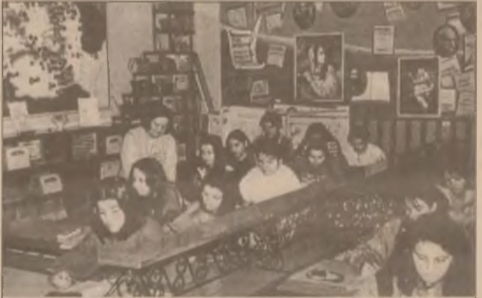
Grupul Școlar de Chimie Industrială Orăștie - ora de Limba și literatura română

Sărbătorile de iarnă sunt prilej de bucurie pentru toți copiii, iar cei care trăiesc la Centrul de Plasament nr. 1 din Orăștie nu fac excepție. Pentru a-și exprima fericirea pentru venirea sărbătorilor și pentru a-i face o bună primire lui Moș Crăciun, copiii de aici vor organiza un spectacol de colinde și poezie în data de 17 decembrie a.c. Cu această ocazie se vor împărți daruri și, în acest scop, se solicită sprijinul tuturor agenților economici interesați în ajutorarea acestor copii cu care soarta nu a fost prea dărnice.