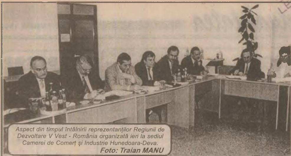
Aspect din timpul întâlnirii reprezentanților Regiunii de Dezvoltare V Vest - România organizată ieri la sediul Camerei de Comerț și Industrie Hunedoara-Deva.