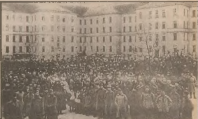
Regimentul 64 infanterie Orăștie depune jurământul de credință față de națiunea română la Viena.