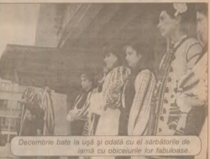
Decembrie bate la ușă și odată cu el sărbătorile de iarnă cu obiceiurile lor tabuloase.