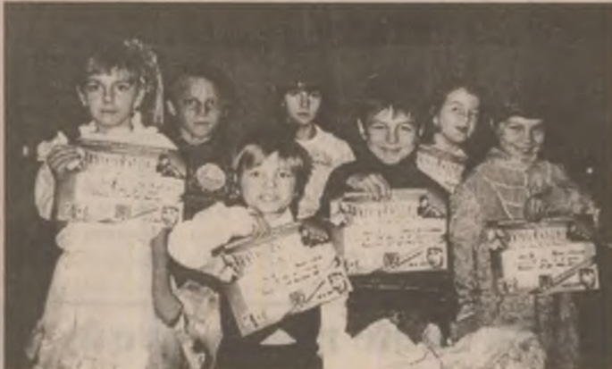
Luni, 30 noiembrie a.c., la Cinematograful "Zarand" din Brad s-a desfășurat concursul TIP-TOP MINI-TOP la care au participat elevi din clasa I. Cei mai buni au primit diplome și dulciuri în semn de apreciere pentru evoluția pe scenă.

Deși ultima hotărâre privind închirierea prin licitație publică a unor spații pentru realizarea de parcuri auto acoperite a generat multe și contradictorii discuții. Până la urmă ea a fost adoptată cu mai multe amendamente.