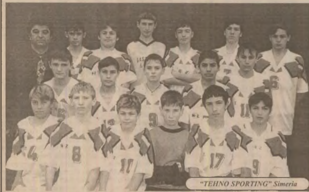
"TEHNO SPORTING" Simeria

născuți în anii 1984 - 1986 (din cele două școli generale existente în Simeria) pe cei pe care a considerat că au cele mai bune calități