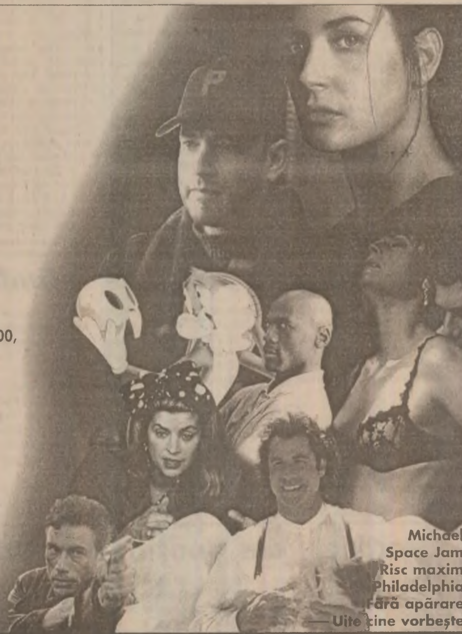
Michael Space Jam Risc maxim Philadelphia Fără apărare — Uite cine vorbește

...cu 12 luni înaintea oricărei alte apariții pe micul ecran