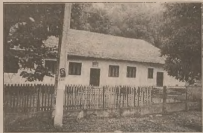
Căminul cultural din satul Visca aparținător comunei Vorța a fost recent renovat.