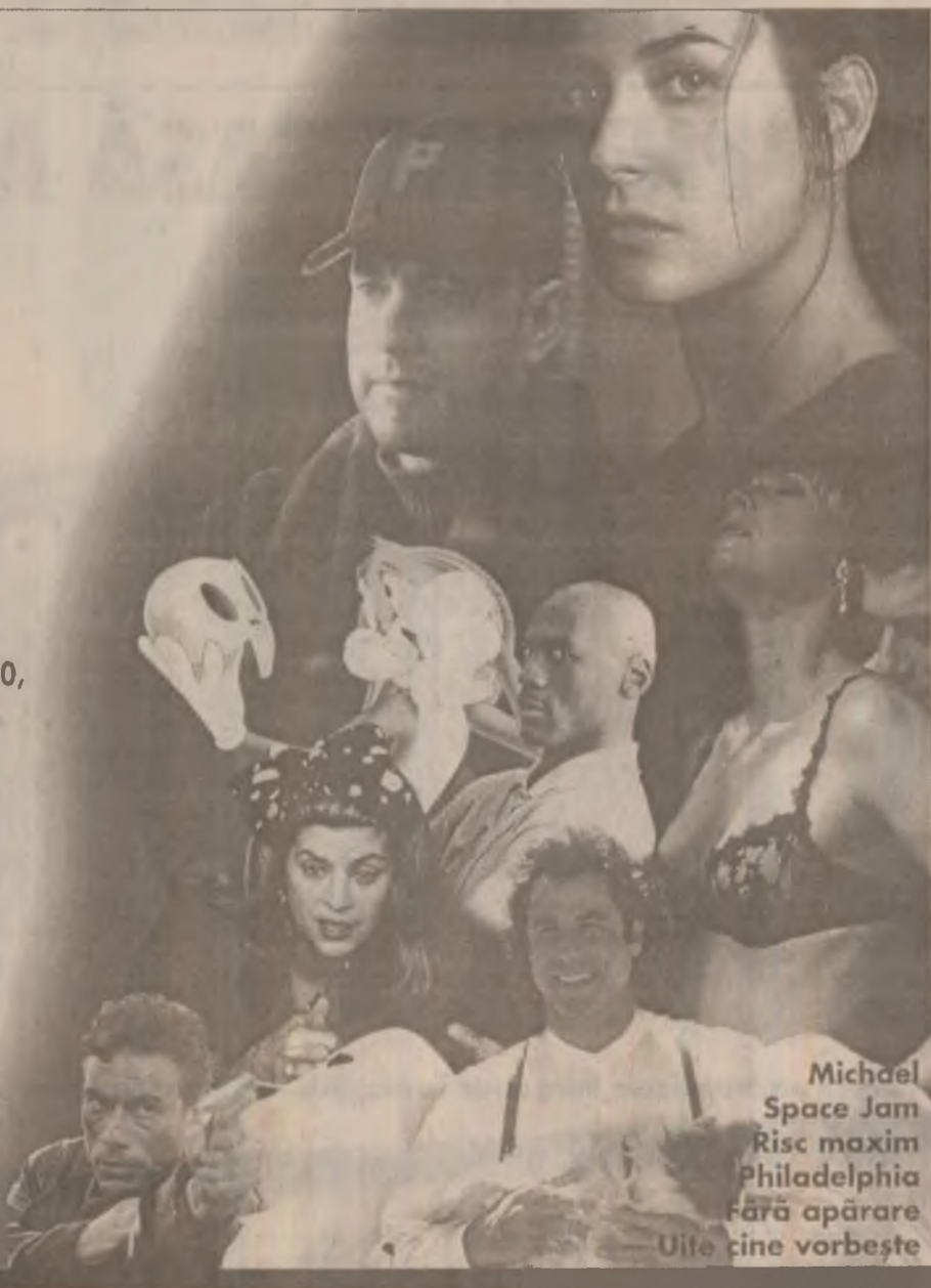
Michael Space Jam Risc maxim Philadelphia Fără apărare Uite cine vorbește

● Direct la domiciliul dumneavoastră, prin agenții de vânzare HBO