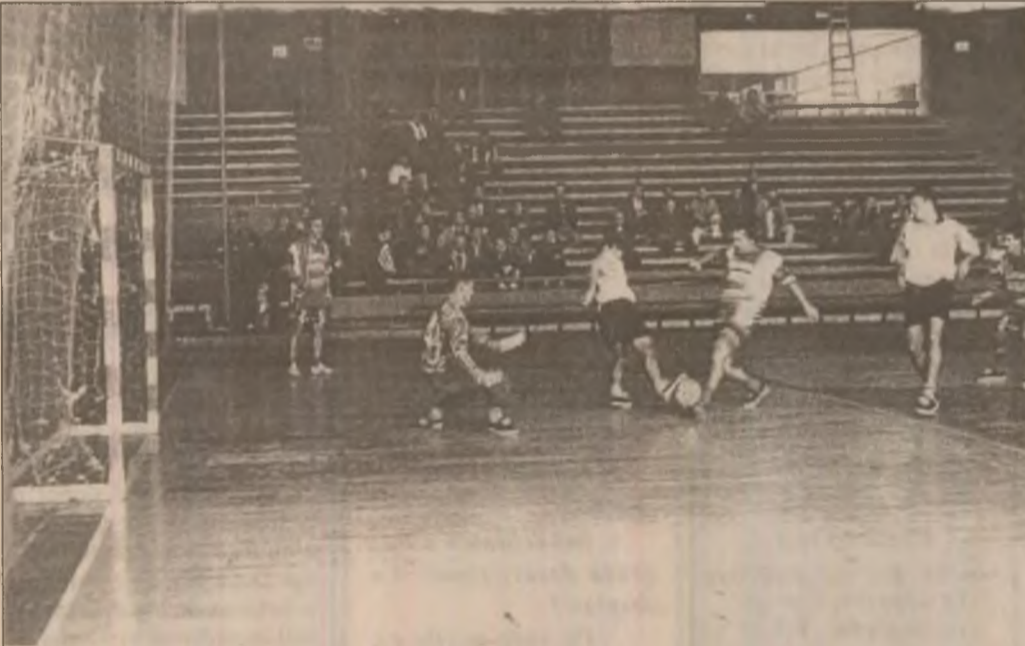
Fotbalul de sală atrage mulți spectatori. Fază din recentul turneu de la Deva al divizionarelor B și C.

Și-au dat întâlnire cei mai buni sportivi ai țării, performeri la o seamă de întreceri internaționale, Campionate Mondiale și Campionate Europene, fiind răsplătiți pentru succesele înregistrate și faima adusă sportului românesc. Amănunte despre premii și premii, în rubrica sport a ziarului nostru de mâine. (C.S.)