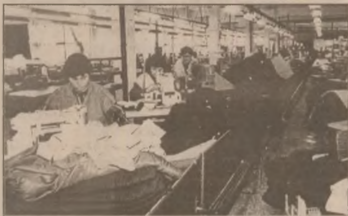
Aspect din secția de confecții a SC MEROPA din Hunedoara unde se produc confecții textile pentru partenerii străini din Franța, Anglia, Germania.