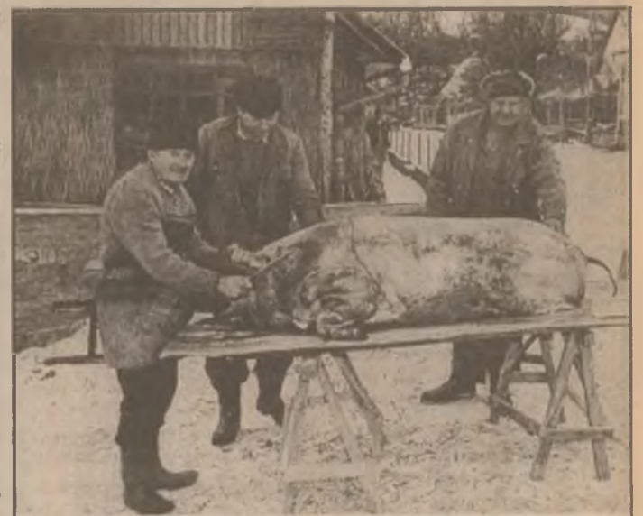
Semn că sărbătorile sunt aproape. Să-l mâncați sănătoși!