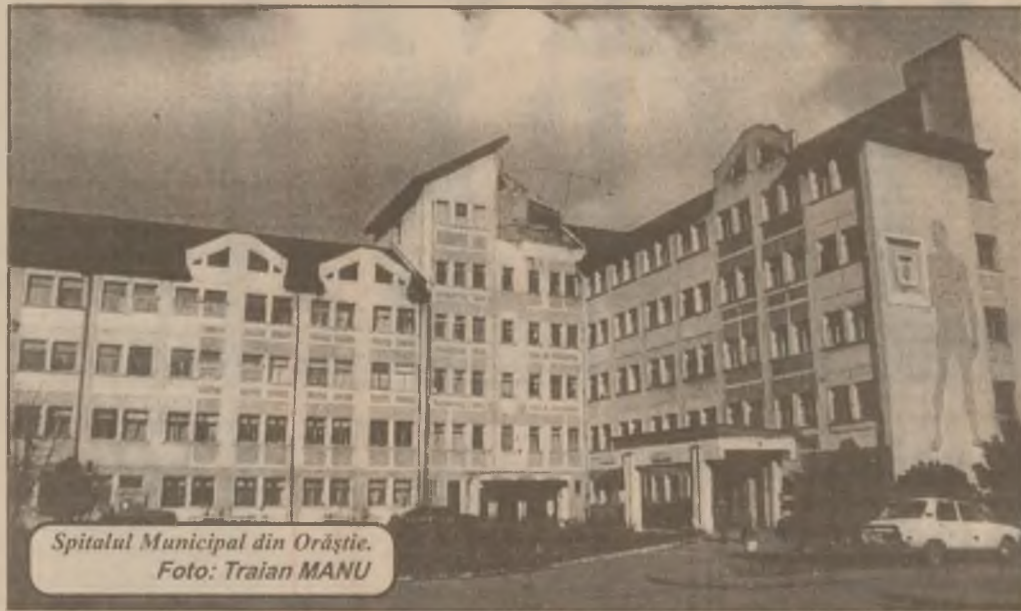
Spitalul Municipal din Orăștie.

și teletransmisie la nivelul cerințelor oricărei bănci performante, toate operațiunile efectuându-se în timp real, printr-o rețea proprie de calculatoare. De asemenea, la nivel performant sunt și sistemele de pază și alarmare, cât și linia cu circuit intern de televiziune. Având ca obiectiv prioritar dinamizarea în special a activității economice în zona vestică a țării, în perioada următoare West Bank își va deschide noi sucursale în județele Alba, Mureș, Sibiu și Cluj.