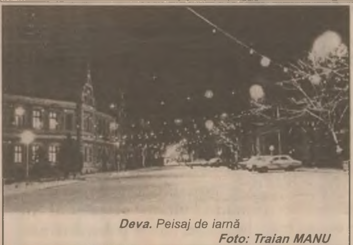
Deva. Peisaj de iarnă