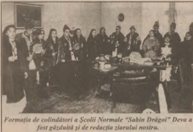
Formația de colindători a Școlii Normale "Sabin Drăgoi" Deva a fost găzduită și de redacția ziarului nostru.