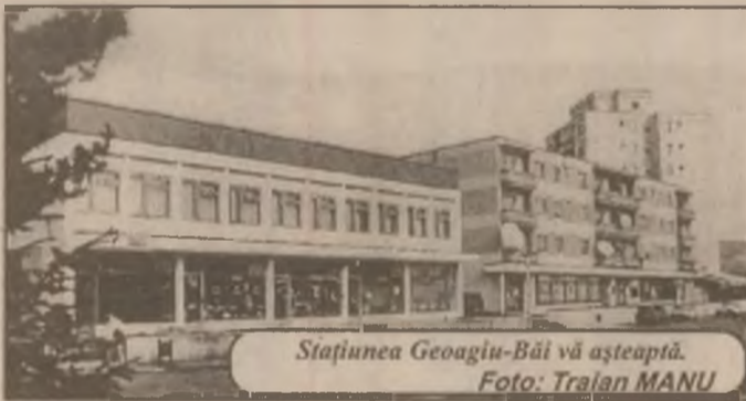
Stațiunea Geogiu-Băi vă așteaptă.

artiștii plastici ai cenaclului „Siderurgistul” Hunedoara, cum sublinia dl Mircea Bătoacă, președintele filialei, lucrările lor, prin realizarea artistică, justificând această prezență. Expoziția cuprinde pictură, sculptură, grafică și arte decorative, opere realizate în tehnici și din materiale diferite, fiecare purtând amprenta stilului propriu al creatorului, ușor de recunoscut pentru cei care trec mai des pragul galeriei de artă.