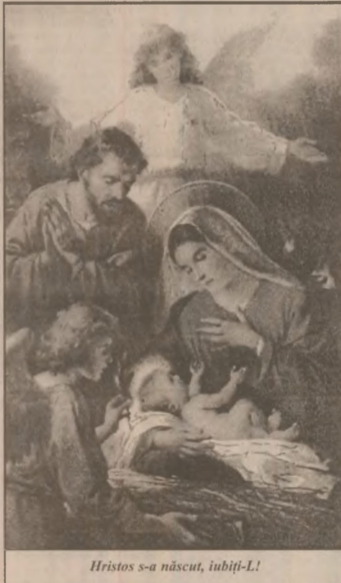
Hristos s-a născut, iubiți-L!

Pe cale să devină o frumoasă tradiție, „Salonul de iarnă '98”, organizat de Inspectoratul pentru Cultură și Uniunea Artiștilor Plastici - Filiala Deva, s-a vernisat marți după-amiază. Gazduită de Galeria „Forma”