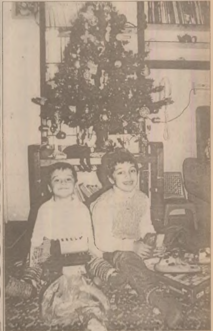
Sub pomul de Crăciun, copiii au găsit jucării și dulceni aduse de Moș Crăciun

31 dec. 1968 - s-a stins din viață compozitorul și folcloristul Sabin Drăgoi . A creat numeroase lucrări simfonice, muzică de cameră, muzică vocal-simfonică și de filme. A fost membru al Uniunii Compozitorilor din România și membru al International Folk Music Council din Londra.