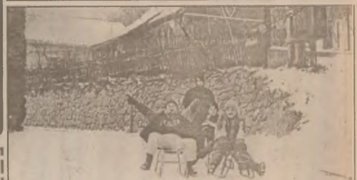
Vacanță, zăpadă, sănăuș, bucuria copiilor