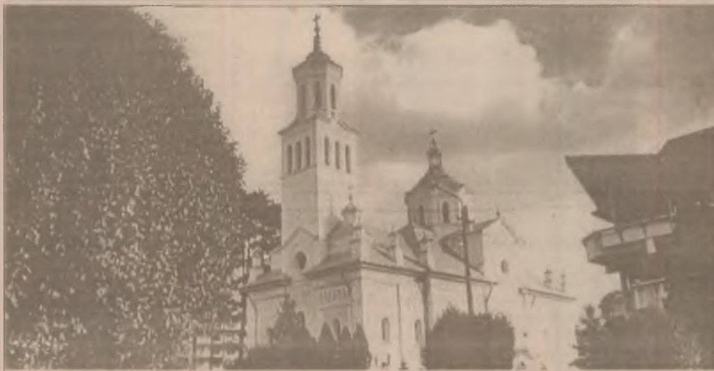
Catedrala Ortodoxă Sf. Nicolae din municipiul Deva, unde de Crăciun s-a oficiat slujba Nașterii Mântuitorului Isus Hristos.

Obicei călușeresc. Premiul II - Tractorul II Brașov; Premii speciale. Vlcele (Olt), Balșa, Mărtinești, Poplaca (Sibiu); Premiu de onoare. Săliște (Alba)