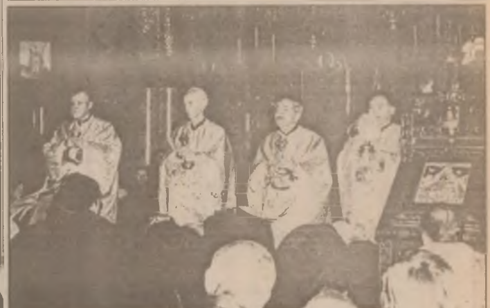
De sărbători, bisericile devin neîncăpătoare. Aspect din timpul slujbei de Crăciun la Catedrala Ortodoxă din Deva