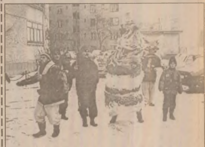
Cu capra ori cu ursul în prima zi de Crăciun au pomit colindătorii