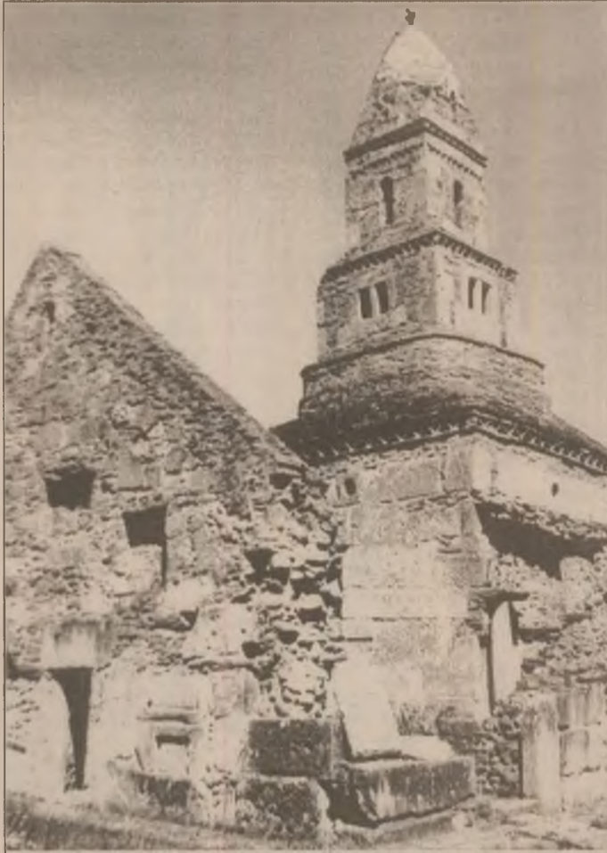
Biserica paleocreștină din Densuș, sec.IV - XII