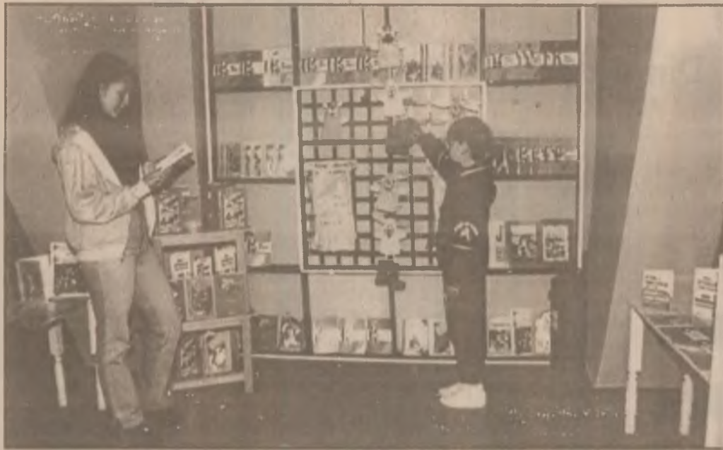
O carte este oricând un dar nimerit pentru mari și mici