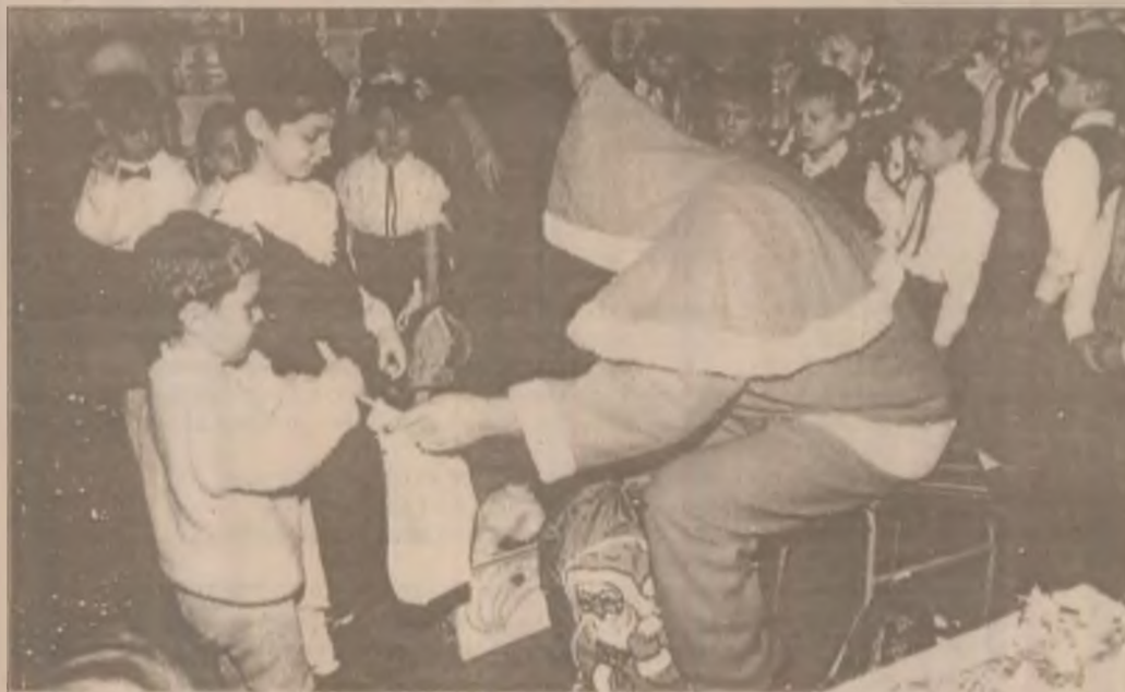
Moș Crăciun a sosit și la Grădinița cu program normal nr.1 din Deva

Măcar acum am fi vrut ca lucrurile să pară altfel. Măcar în răstimpul ăsta s-ar cuveni să fim mai îngăduitori. Măcar când iarna își împlinește promisiunea sărbătorilor și când anul se petrece ni s-ar potrive o mai adâncă smerenie și mai bogată bucurie.