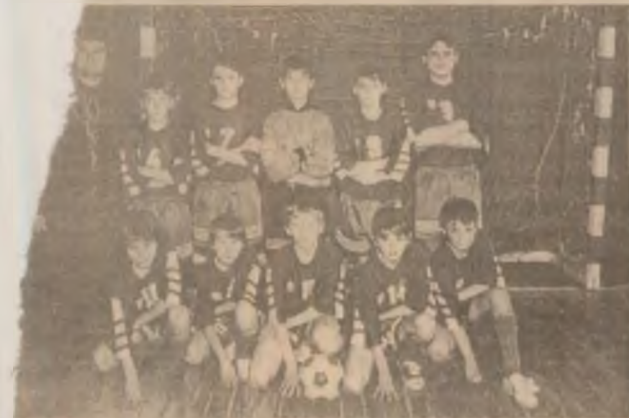
TehnoSporting Simeria - laureata turneului la categoria de vârstă 1985