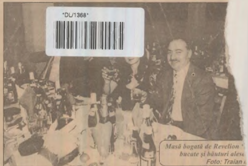
Masă bogată de Revelion bucate și băuturi alese

Ca în fiecare an, energeticienii de la Mintia care lucrează la bornele generatoarelor, în sălile cazanelor și turbinelor, în depozitele de combustibil ori în marile camere de comandă a luminii și căldurii s-au aflat pe rând la posturi în zilele de sărbătoare a sfârșitului și începutului de an. După cum ni s-a spus ieri dimineață, activitatea a decurs fluent, fără probleme, lumina și căldura ajungând la parametri optimi în fiecare casă din municipiul Deva și nu numai, oferind sărbătorii Revelionului strălucire și bucurie. La mulți ani, prieteni! (D.G.)