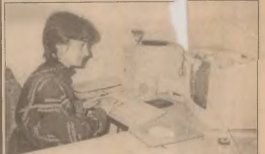
Prin informatizarea serviciilor din cadrul Primăriei Geoagiu, cetățeanul economisește timp, iar problemele ridicate sunt soluționate prompt.

Condițiile extreme de dure care se prefigurează pentru 1999, exclud dificultăți și în acest sens. Incertitudinea noului buget pentru anul viitor a pus deja pe gânduri autoritățile locale care spun că, de ajutoarele sociale reprezintă o prioritate, întrucât există multe familii care depind numai de aceste bani, lipsa unor reglementări clare nu exclude lunile următoare dificultăți și în acest sens amânarea sau neplata la zi a acestor bani pentru familii cu probleme. (C.P.)