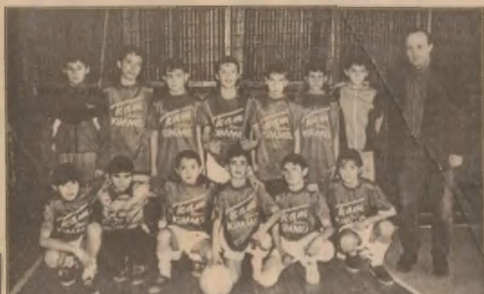
Corvinul Hunedoara - locul I la categoria de vârstă 1986