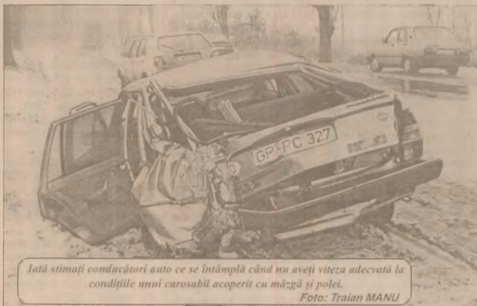
Iată stămați conducători auto ce se întâmplă când nu aveți viteza adecvată la condițiile unui carosabil acoperit cu mazăg și polei.

Nu s-au înregistrat victime omenești, incendiul fiind lichidat de pompieri. (V.N.)