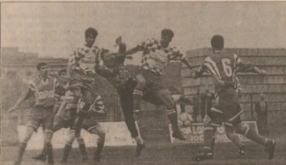
Au mai rămas puține zile până la reluarea pregătirilor fotbaliștilor și primele meciuri amicale, de verificare

Dacă ambii jucători vor evolua la aceste formații, va crește numărul jucătorilor români ce vor juca în Coreea de Sud.