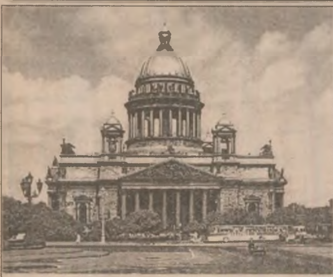
SANKT PETERSBURG - Catedrala Sf. Isaac, în prezent muzeu