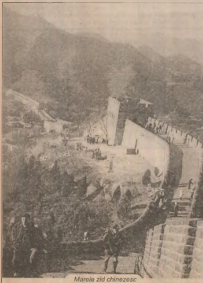
Marole zid chinezesc

dolari. "Armageddon", un film care îl are în rolul principal pe Bruce Willis, a avut încasări de două sute de milioane de dolari. Un alt film, "There's Something About Mary", destul de blamat de critica americană, a avut un succes-monstru la public, reușind să aibă încasări mondiale de 325 de milioane de dolari, la un buget de doar 25 de milioane de dolari.