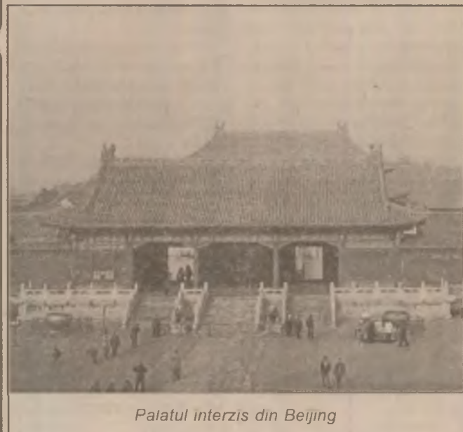
Palatul interzis din Beijing

Televirtual a fost înființată în primăvara anului trecut cu scopul de a obține bani din producția de filme publicitare pe care să-i reinvestească apoi în filme artistice, dar evoluția pieței nu a corespuns așteptărilor, în ciuda dublării cheltuielilor de