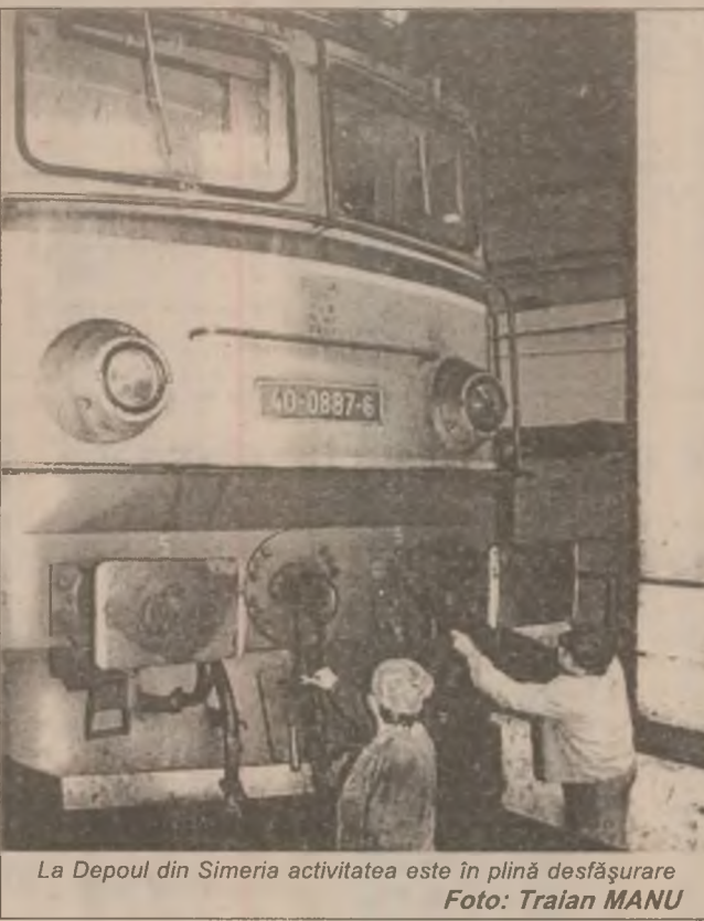
La Depoul din Simeria activitatea este în plină desfășurare

Chiar dacă starea unor (sau mai multor) monumente istorice sau de arhitectură este departe de ceea ce ar trebui și ne-am dori să fie, acestea nu sunt lăsate de izbeliște, la ele se fac lucrări de cercetare, de conservare și restaurare. Din nefericire fondurile alocate sunt insuficiente față de necesități. Sau, în unele cazuri, apare și o neînțelegere a importanței și valorii acestor monumente sau chiar rea-voință.