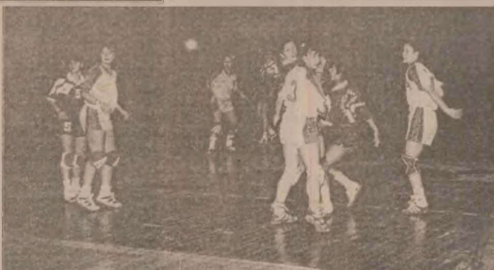
Lotul echipei de handbal feminin Universitatea Roman Deva și-a început pregătirile O fază de joc din meciul U. Roman Deva - România tinoret