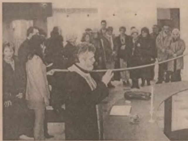
Aspect din timpul deschiderii oficiale a supermagazinului INTO Deva.

Cei prezenți au vizitat apoi articolele expuse la