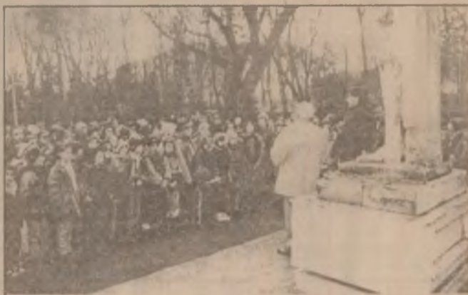
Aspect de la festivitatea de comemorare a marelui Eminescu desfășurată la statuia poetului din Parcul de la poalele cetății Deva.