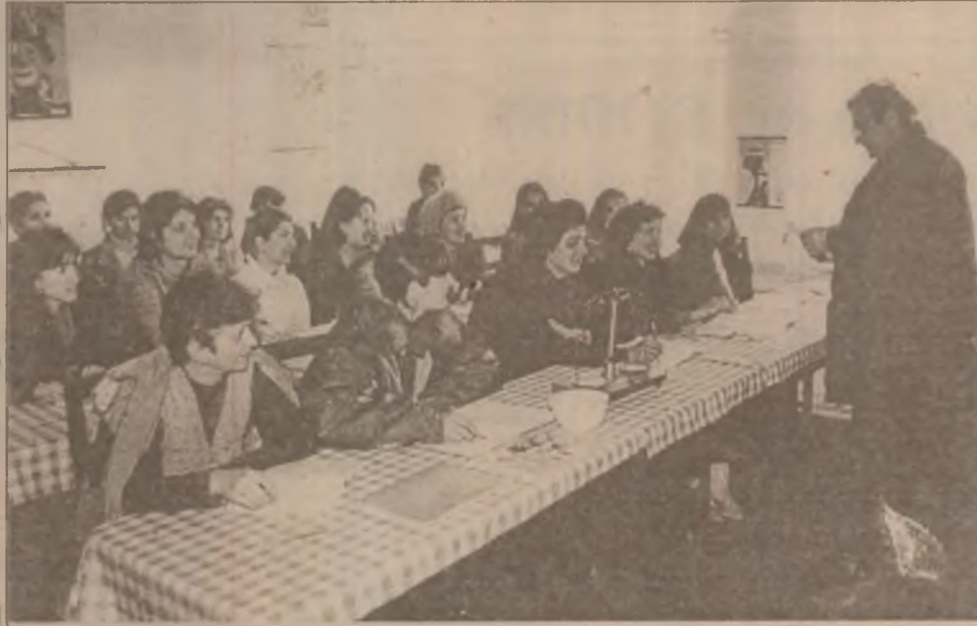
Călen. Viitorii asistenți farmacie participă cu interes la cursurile de pregătire teoretică.