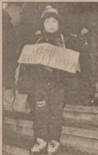
La Petroșani, în timpul grevei părinților, copiii mai spun și altceva

Capul care se pleacă înseamnă că salută.