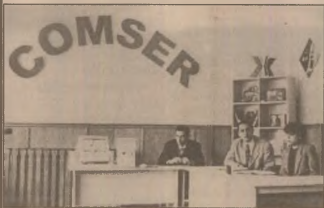
Aspect de la inaugurarea noului magazin Comser din Hunedoara.