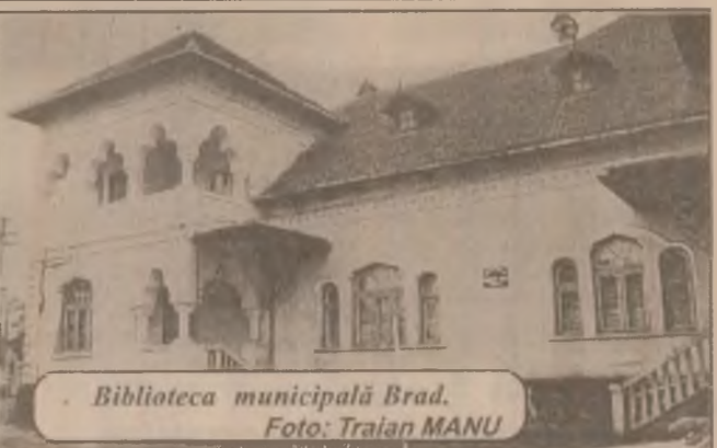
Biblioteca municipală Brad.

cei mai importanți fiind "Agrosim" și "Agromec" din Simeria și "Sansere" din Sântandrei. Sumele neincasate sunt de 75,14 milioane lei la impozitul pe clădiri, 19,9 milioane lei la impozitul pe teren și 25,9 milioane lei la taxa pe mijloacele de transport. (A.S.)