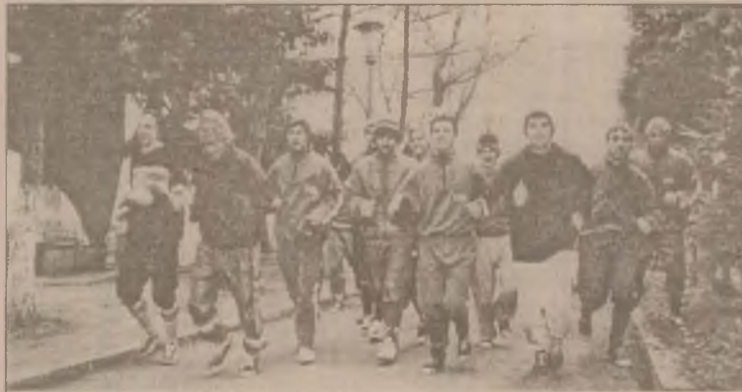
Secvență din timpul unui antrenament în cantonament la Geoagiu-Băi al fotbalistilor de la Vega Deva