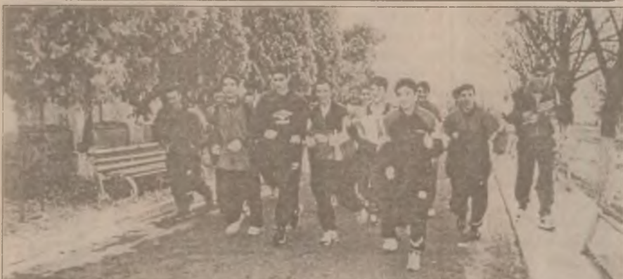
Într-un decor hibernal, lotul echipei F.C. Corvinul în timpul pregătirii fizice la Cinciș