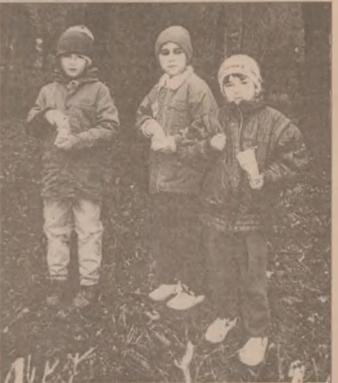
Până la bomboane, sunt bune și semințele...

Directorul Agenției de Evaluare susține că un astfel de test este absolut necesar, întrucât capacitatea este un examen nou, iar rezultatele acestuia permit specialiștilor, dar și elevilor și profesorilor, să insiste asupra acelor aspecte înțelese greșit. (A.N.)